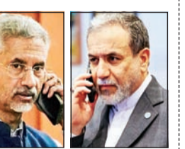
भारतीय जहाजे बुधवारी रात्री ते

इराण युद्धामुळे पर्शियन आखाताला ओमानच्या आखाताशी जोडणारा अरुंद जलमार्ग सध्या बंद आहे. जगातील कच्च्या तेल एक पंचमांश भाग सामान्यतः होर्मुझच्या सामुद्रीधुनीतून जातो. अमेरिकेक आणि इस्पायलने इराणवर केलेल्या हल्ल्यांमुळे द्रवीभूत पेट्रोलियम वायू, द्रवीभूत नैसर्गिक वायू आणि कच्चे तेल असलेले हे टँकर्स होर्मुझच्या सामुद्रीधुनीत अडकले आहेत.