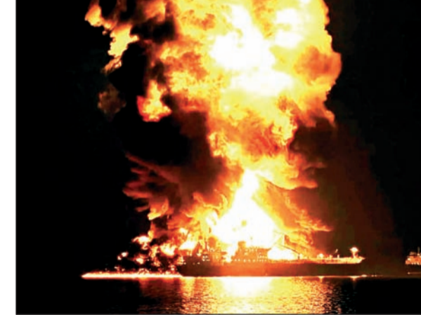
अटी मान्य करा, युद्ध थांबवतो : पेझेश्किन

इराकच्या खोर अल-जुबैर बंदराजवळ इराणी आत्मघातकी नौकेने अमेरिकन तेल टँकरवर हल्ला केला. या घटनेत एका भारतीय नागरिकाचा मृत्यू झाला, तर २७ चालक दलाचे सदस्यांना वाचवण्यात यश आले. हल्ला झालेल्या जहाजाचे नाव 'सफेसी विष्णू' आहे, जे मार्शल बेटांचा ध्वज फडकवणारे एक अमेरिकन जहाज आहे. हल्ल्याच्या वेळी त्यात एकूण २८ लोक होते. एका भारतीयचा मृत्यू झाला, तर उर्वरित २७ जणांना सुरक्षितपणे वाचवण्यात आले. सुटका केल्या सर्व कर्मचाऱ्यांना इराकमधील बसरा येथे नेण्यात आले, अशी माहिती अमेरिकेच्या नौदलाने दिली आहे.