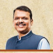
देवेंद्र फडणवीस मुख्यमंत्री