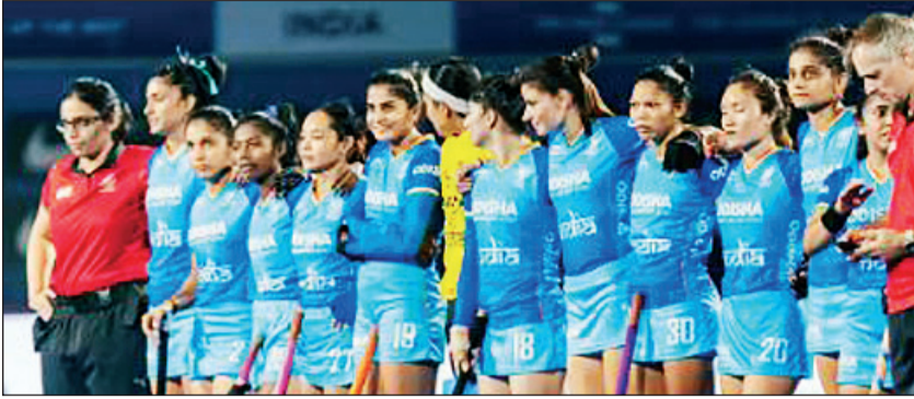
उपांत्य फेरीसाठी भारतीय महिला हॉकी संघ सज्ज

एक विजय, एक बरोबरी आणि एक पराभव नोंदवून इटलीने गट अ मध्ये चार गुणांसह दुसरे स्थान मिळवले. यामुळे उपांत्य फेरीपूर्वी यजमान संघाला थोडी मानसिक आघाडी मिळाली. भारत सध्या चार गोलसह स्पर्धेतील संयुक्त सर्वाधिक गोल करणाऱ्या फॉर्मवर नवीन कोरच्या प्रभावी फॉर्मवर भर देण्याचा प्रयत्न करेल. तिने वेल्सविरुद्धच्या