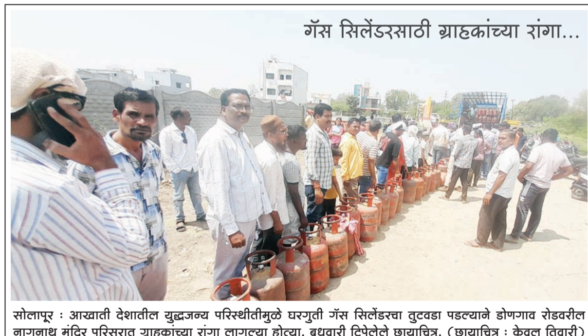
सोलापूर : आखाती देशातील युद्धजन्म परिस्थितीमुळे घरगुती गॅस सिलेंडरचा तुटवडा पडल्याने डोंगगाव रोडवरील नागनाथ मंदिर परिसरात ग्राहकांच्या रांगा लागल्या होत्या. बुधवारी टिपेलेत छायाचित्र.

कायमस्वरूपी सेवा व वेतनवाढ मागणी गेल्या १३ वर्षांपासून आरोग्यमित्र या योजनेत काम करत असूनही त्यांना खासगी टी.पी.ए. कंपनीमार्फत केवळ १४,७९१ रुपये इतके अल्प मानधन दिले जाते. आरोग्यमित्रांना कायमस्वरूपी सेवा व वेतनवाढ द्यावी, अशी मागणीही करण्यात आली आहे.