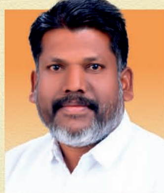
दत्तात्रय मरगु नडगिरी