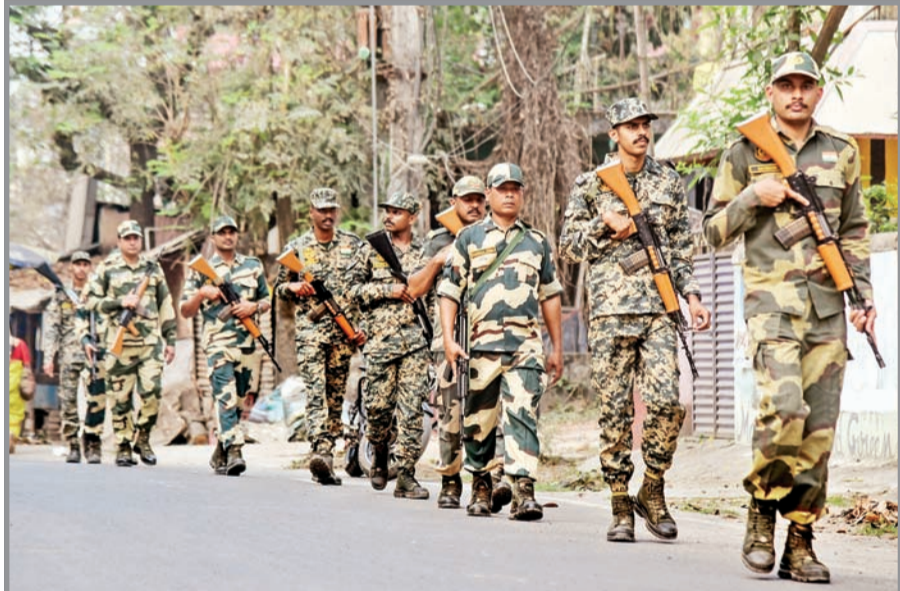
पश्चिम बंगालमध्ये कधीही विधानसभा निवडणुकीची घोषणा होऊ शकते, आयोगाच्या अधिकाऱ्यांनी नुकताच राज्यातील सुरक्षा व्यवस्थेचा आढावा घेतला. कायदा व सुव्यवस्था अबाधित राहावी यासाठी दक्षिण दिनाजपूर जिल्ह्यातील बालुघाट येथे मंगळवारी सुरक्षा दलाच्या जवानांनी पथसंचलन केले