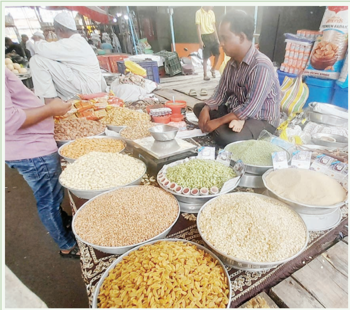
सोलापूर : रमजान ईदनिमित्त सोलापुरातील विजापूरवेस परिसरात उभारण्यात आलेल्या ड्रायफ्रूट्स मार्केटमध्ये सुकामेवा दाखल झाला.

आप्पा गणपती प्रतिष्ठानच्या माध्यमातून दरवर्षी विविध सामाजिक, सांस्कृतिक, शैक्षणिक आणि जनजागृतीपर उपक्रम राबविले जातात. या उपक्रमांची दखल घेत राज्य शासनाकडून मिळालेला हा सन्मान दाजी पेठ परिसरासाठी अभिमानाची बाब मानली जात आहे. मंडळाच्या या यशाबद्दल विविध स्तरांतून अभिनंदन करण्यात येत आहे.