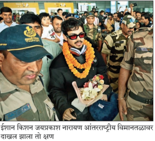
ईशान किशन जयप्रकाश नारायण आंतरराष्ट्रीय विमानतळावर दाखल झाला तो क्षण

पाटणा, १० मार्च भारताचा अव्वल क्रमांकाचा फलंदाज ईशान किशन मंगळवारी पाटण्यात पोहोचला. यावेळी त्याचे जल्लोषात स्वागत करण्यात आले. टी-२० विश्वचषकात भारताच्या जेतेपदात त्याने महत्त्वाची भूमिका बजावली. काही महिन्यांपूर्वीपर्यंत तो राष्ट्रीय संघात नव्हता हे लक्षात घेता, ईशानचे पुनरागमन खूप प्रेरणादायी होते. डावखुरा फलंदाज ईशानने रविवारी अहमदाबादमध्ये न्यूझीलंडविरुद्धच्या अंतिम सामन्यात अर्धशतक झळकावले आणि यापूर्वी पाकिस्तानविरुद्ध कठीण खेळपट्टीवर सामना जिंकणारी खेळी खेळली होती. अंतिम सामन्याच्या तयारीदरम्यान, ईशानच्या चुलत भावाचा अपघातात मृत्यू झाला होता. पाटणा येथे पोहोचल्यानंतर ईशान म्हणाला की संघ भविष्यात अधिक जेतेपद जिंकण्यासाठी वचनबद्ध आहे. हे भारताचे विक्रमी तिसरे टी-२० विश्वचषक विजेतेपद आहे. देशांतर्गत क्रिकेटमध्ये झारखंडकडून खेळणारा ईशान म्हणाला की, भारतीय संघाचा विजय हा संपूर्ण देशासाठी अभिमानाचा क्षण आहे. ◀(वृत्तसंस्था)