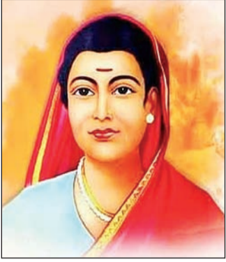
क्रांतिज्योती सावित्रीबाई फुले यांची आज पुण्यतिथी