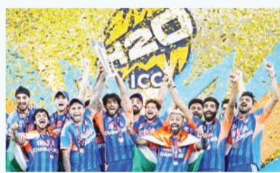
संघाने न्यूझीलंड संघाचा ९६ धावांनी पराभव करत तिसऱ्यांदा टी-२० विश्वचषक जिंकण्याचा मान

◆ मुंबई : आयसीसी टी-२० विश्वचषक २०२६ स्पर्धेत न्यूझीलंडवर ९६ धावांनी दणदणीत विजय मिळवत भारताने इतिहास रचला. या भव्य यशाबद्दल राज्याच्या विधानसभेत मुख्यमंत्री देवेंद्र फडणवीस यांनी भारतीय क्रिकेट संघाच्या अभिनंदनाचा प्रस्ताव मांडत खेळाडूंच्या कामगिरीची कौतुक केले. अहमदाबादमधील जगातील सर्वात मोठ्या क्रिकेट मैदानावर असलेल्या नरेंद्र मोदी स्टेडियम येथे झालेल्या अंतिम सामन्यात भारतीय क्रिकेट