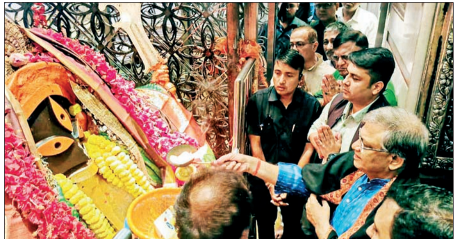
कालीघाट मंदिर येथे आरती करताना मुख्य निवडणूक आयुक्त ज्ञानेश कुमार

'चले जाव'च्या घोषणा; काळे झेंडेही दाखवले