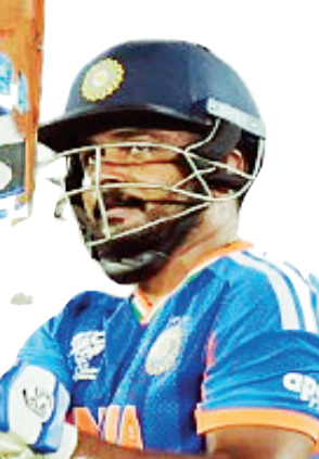
पोहोचल्यानंतर संघाला पुनर्विचार करावा लागला.

१.२० च्या सरासरीने केवळ ४६ धावा काढल्या. त्याला वाळण्यात आले व पब्लिकक्षक म्हणून ईशान किशनला संधी देण्यात आली, परंतु दक्षिण आफ्रिकेविरुद्धच्या टप्प्यातील पराभवानंतर भारत बाहेर पडण्याच्या उंबरठ्यावर पोहोचल्यानंतर संघाला पुनर्विचार करावा लागला. झिम्बाब्वेविरुद्धच्या विजयी सामन्यात संधी मिळाल्याने, सॅमसनने १५ चेंडूत २४ धावांची धमाकेदार सुरुवात केली व भारताला ४ बाद २५६ धावसंख्येचा भक्कम पाया रचून दिला. त्या खेळीमुळे त्याचा आत्मविश्वास वाढला व त्याने त्यानंतर इंडन गार्डन्सवर वेस्ट