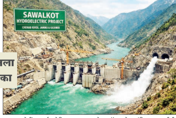
५.१२९ कोटींचा खर्च अपेक्षित असून, संपूर्ण कामकाज एका एकत्रित पॅकेजअंतर्गत राबवले जाणार आहे. टेंडर दस्तावेजांनुसार, या पॅकेजमध्ये डायव्हर्जन टनेल, अँडिडिस, डीटी, कोफर डॅम, तसेच मांडिया नाला डीटी, त्यासंबंधित रस्ते बांधकाम, राइट बँक स्पायरल टनेल, अँक्सेस टनेल आणि धरणाशी संबंधित सर्व पूरक कामांचा समावेश आहे. (वृत्तसंस्था)

◆ नवी दिल्ली, ८ फेब्रुवारी पहलगाय येथे झालेल्या दहशतवादी हल्ल्यानंतर भारताने पाकिस्तानसोबत असलेला सिंधू पाणी करार अनिश्चित काळासाठी स्थगित केला. त्यानंतर आता भारत सरकारने आता जम्मू-कश्मीरमध्ये पायाभूत सुविधा आणि ऊर्जा क्षेत्रासंबंधी महत्त्वाचा निर्णय घेतला आहे. सरकारी क्षेत्रातील कंपनी एनएचपीसीने चिनाब नदीवरील सावलकोट जलविद्युत प्रकल्पाच्या उभारणीसाठी अधिकृतपणे टेंडर प्रक्रिया सुरू केली आहे. रामबन जिल्ह्यात प्रस्तावित असलेल्या या प्रकल्पासाठी सुमारे