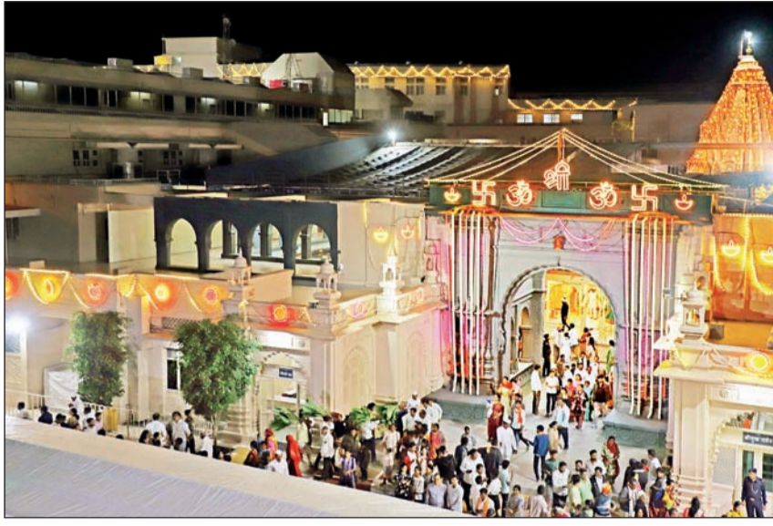
प्रगटदिनानिमित्त श्रीच्या मंदिरावर करण्यात आलेली विद्युत् रोषणाई व दर्शनासाठी झालेली भक्तांची गर्दी