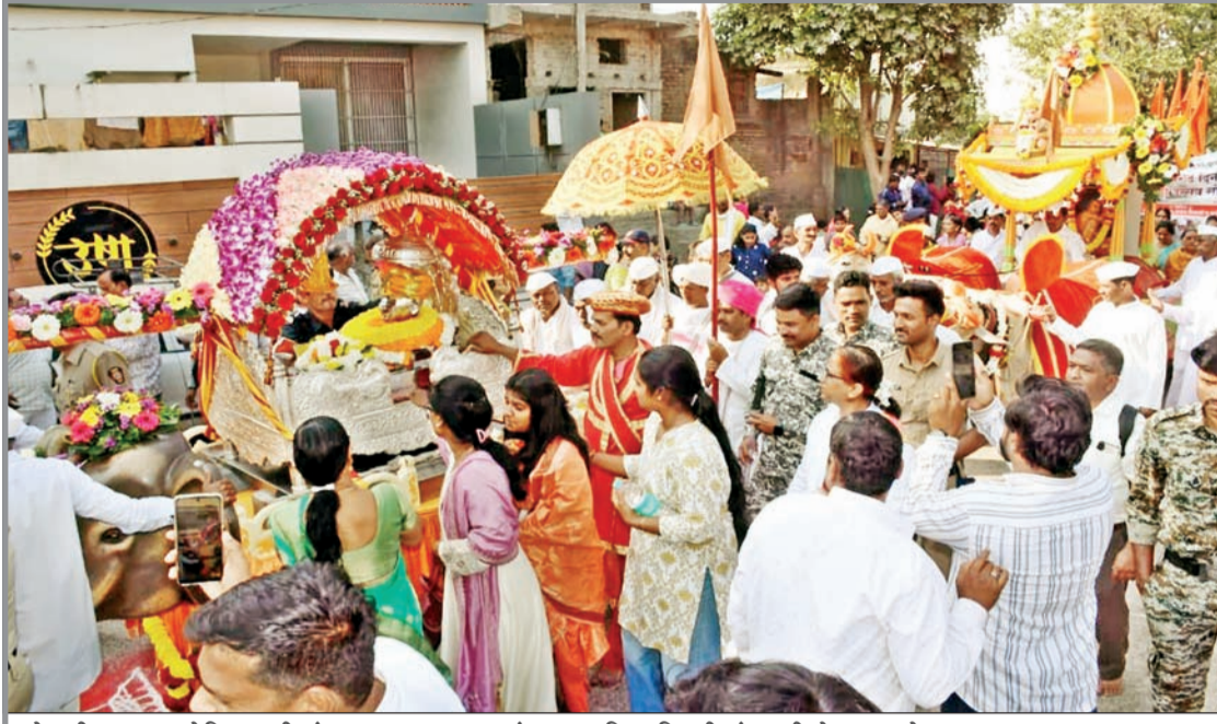
शेगावीचा राणा, योगिराज श्री संत गजानन महाराज यांचा प्रकटदिन रविवारी संतनगरी शेगावात भोठ्या उत्साहात साजरा करण्यात आला. श्रींच्या दर्शनासाठी लाखो भाविकांनी गर्दी केली होती. गण गण गणात बोतेचा गजर करीत भाविक पालखी सोडवण्याला उपस्थित होते. ३२

- एकनाथ रानडे रा. स्व. संधाचे पूर्व सरकार्यावाह, संस्थापक विवेकानंद शिला स्मारक व विवेकानंद केंद्र, कन्याकुमारी