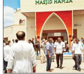
उपाययोजना न केल्यास अमेरिकेला गंभीर परिणाम भोगावे लागू शकते. गिल टेक्सासच्या २६ व्या काँग्रेसनल जिल्ह्याचे प्रतिनिधित्व करतात. २०२४ मध्ये निवडून आल्यापासून, ते त्यांच्या तीव्र स्थलांतर विरोधी भूमिकेसाठी आणि शरियामुक्त मोहीम राबविण्यासाठी ओळखले जातात. त्यांनी अलीकडेच सोमालियातील स्थलांतरितांवर २५ वर्षांपर्यंत बंदी घालण्याचे विधेयक मंडले होते.

अमेरिकेच्या विविध भागात मशिदी बांधल्या जात आहेत. अनेक मशिदी पिढ्यापिढ्या अमेरिकेत राहणाऱ्या नागरिकांच्या घरांजवळ उभारल्यात जात आहेत. गिल म्हणाले, मुस्लिम समुदायाची संख्या देशात वेगाने वाढत असून, यामुळे लोकसंख्याशास्त्र बदलाचा धोका निर्माण झाला आहे. लोक मला सांगतात की जेव्हा ते त्यांच्या स्थानिक मॉलमध्ये जातात तेव्हा ते आजूबाजूला पाहतात आणि असे वाटते की ते टेक्सासमध्ये नव्हे, तर पाकिस्तानमध्ये असल्याचा अनुभव करतात.