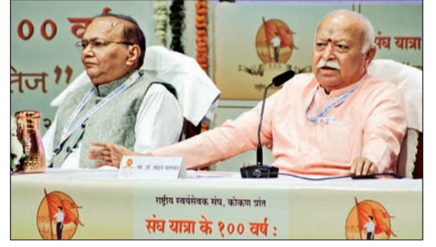
राष्ट्रीय स्वयंसेवक संघ, कोकण प्रांत संघ यात्रा के १०० वर्ष :

हिंदू आणि शीख संबंधांवर बोलताना त्यांनी दोन्ही समाजांमध्ये रक्तसंबंध तसेच रोटी-बेटीचे नाते असल्याचे सांगितले. श्री गुरु ग्रंथासहिबमध्ये देशातील सत्तांची वाणी असल्याने हिंदू-शीख वेगळे