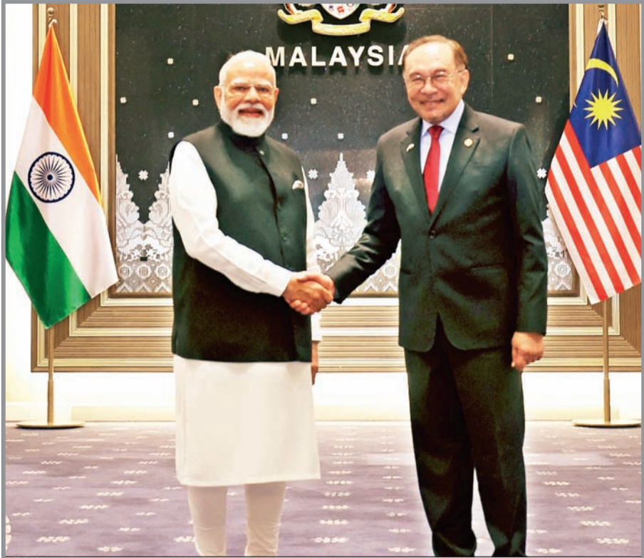
पंतप्रधान नरेंद्र मोदी मलेशियाच्या दौऱ्यावर आहेत. राजधानी क्वालालम्पूर येथे मोदींचे स्वागत करताना मलेशियाचे पंतप्रधान अन्वर इब्राहिम