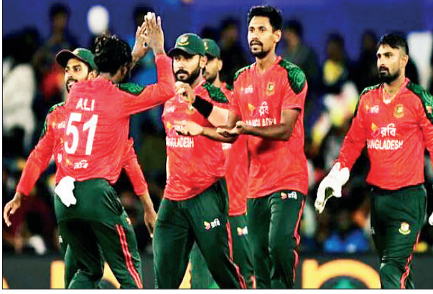
बांगलादेशच्या क्रिकेटपटूंचा भारतात खेळण्यास नकार

दाका, २२ जानेवारी आंतरराष्ट्रीय क्रिकेट परिषदेने (आयसीसी) स्थळ बदलाची मागणी फेटाळल्यानंतर, बांगलादेशने गुरुवारी पुढील महिन्यात भारतात होणाऱ्या टी-२० विश्वचषकासाठी आपला राष्ट्रीय संघ पाठवण्यास नकार दिला. त्यामुळे स्कॉटलंडसाठी त्या देशाची जागा घेण्याचा मार्ग मोकळा झाला आहे. बांगलादेशने एकर भारतात प्रवास करण्यास सहमती द्यावी किंवा बदली होण्याचा धोका पत्करावा, कारण भारतात खेळाडू, अधिकारी किंवा चाहत्यांच्या सुरक्षेला कोणताही विश्वसनीय धोका नाही असा इशारा आयसीसीने बुधवारी दिला होता.