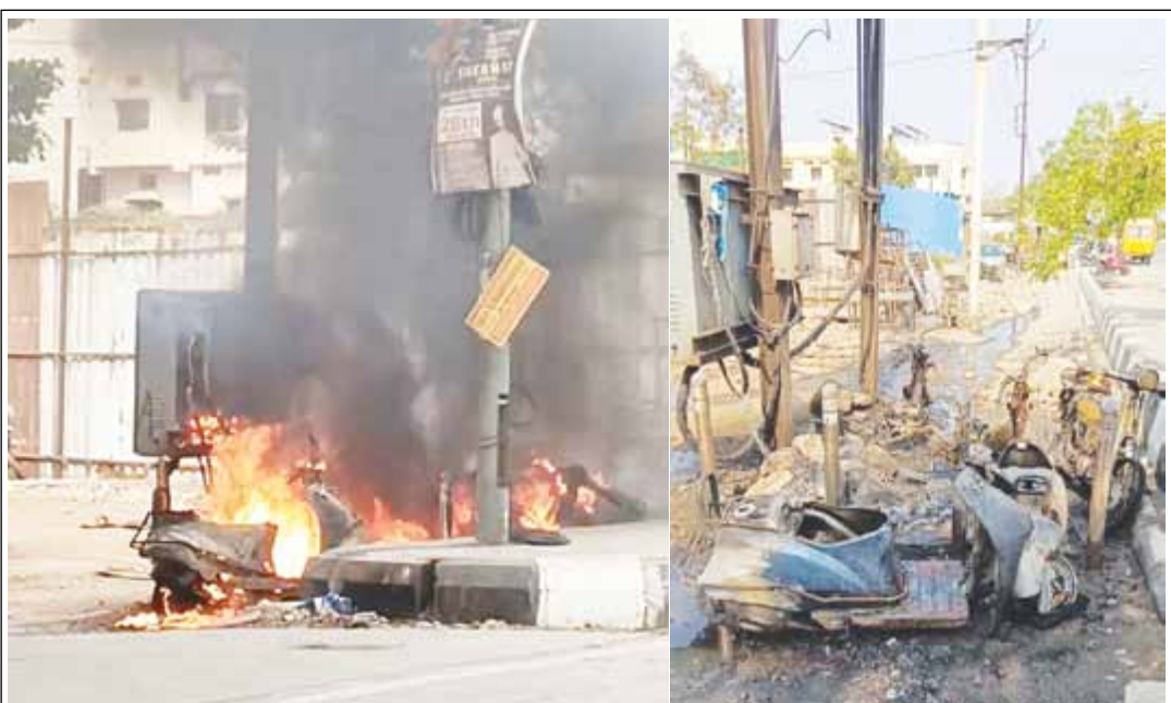
नांदेड - शहरातील चैतन्यनगर-विमानतळ रस्त्यावरील रोहीत्रास आज बुधवारी दुपारी अचानकपणे आग लागली. या आगीत रोहीत्राशेजारी लावलेल्या चार दुचाकी जळून खाक झाल्या.