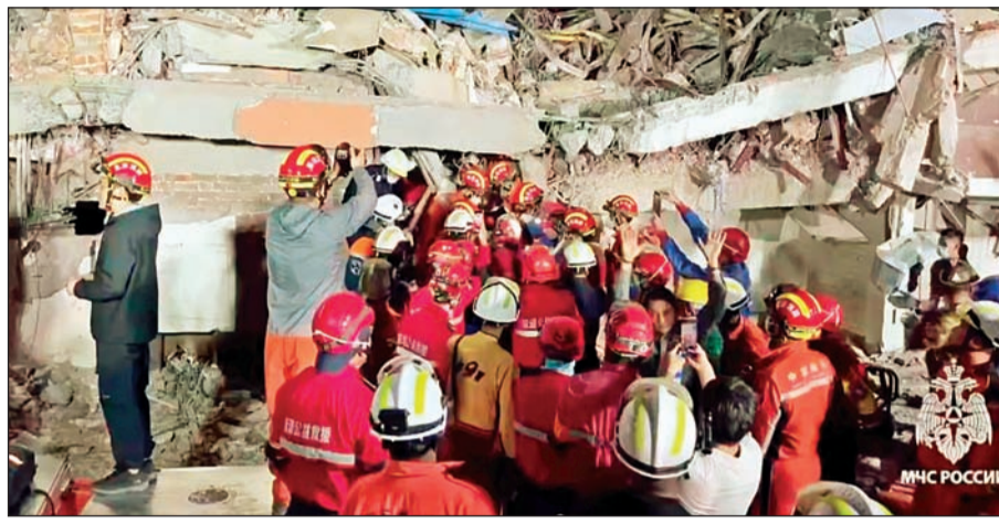
म्यानमारमधील मंडाले येथील मलब्याखाली दबलेल्या महिलेला बाहेर काढताना रशियन मदत पथकाचे जवान

नागरिकांना दिगाऱ्याकडून काढण्याचे काम युद्धस्तरावर