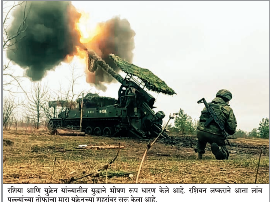
रशिया आणि युक्रेन यांच्यातील युद्धाने भीषण रूप धारण केले आहे. रशियन लष्कराने आता लांब पल्ल्यांच्या तोफांचा मारा युक्रेनच्या शहरांवर सुरू केला आहे.