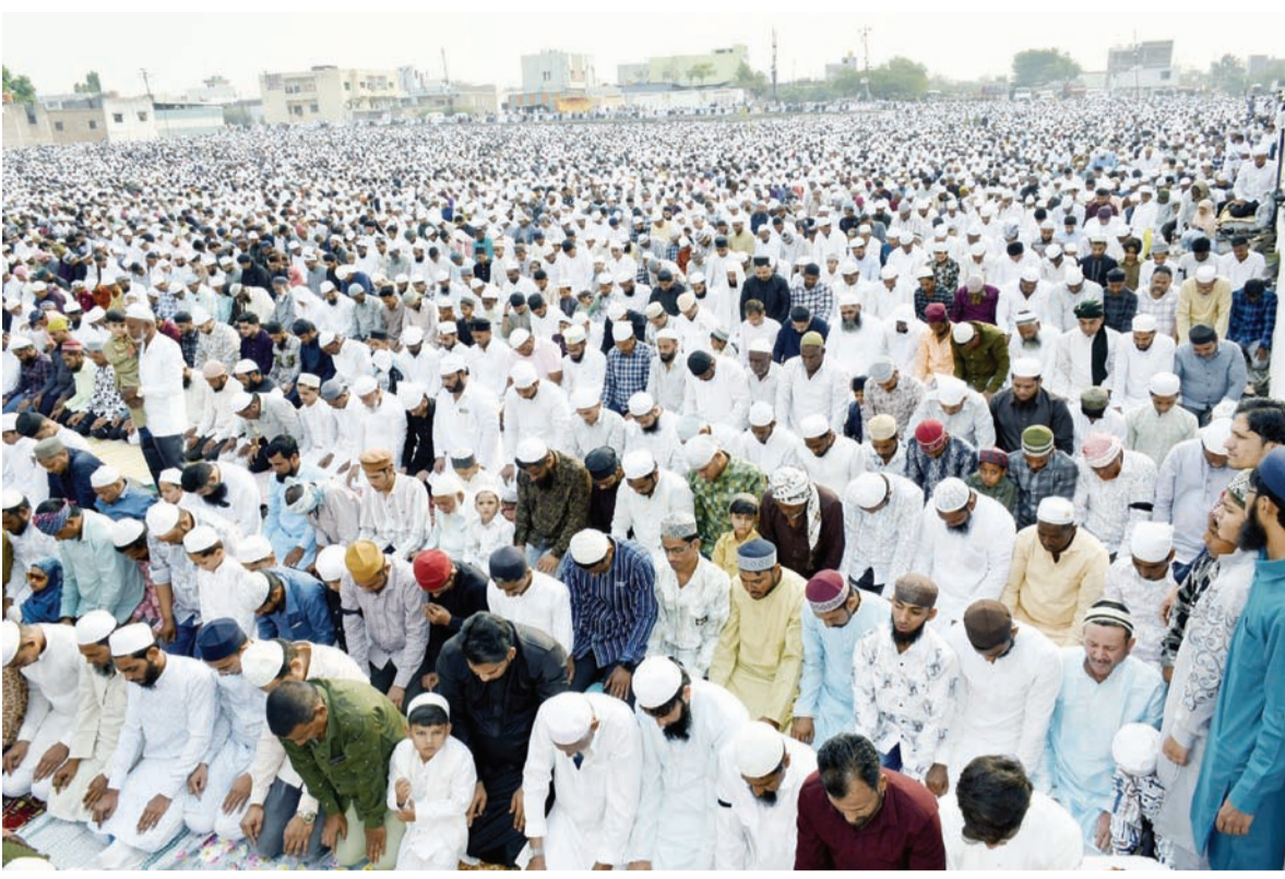
नांदेड- शहरासह जिल्ह्यात रमजान ईद उत्साहात साजरी करण्यात आली. ईदगाह मैदानावर हजारांच्या संख्येने उपस्थित राहून मुस्लिम समाज बांधवांनी नमाज अदा केली.