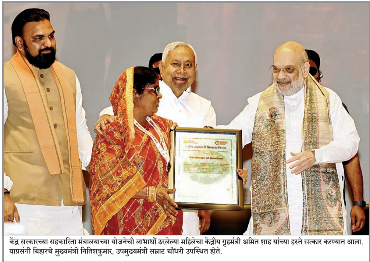
केंद्र सरकारच्या सहकारिता मंत्रालयाच्या योजनेची लाभार्थी ठरलेल्या महिलेचा केंद्रीय गृहमंत्री अमित शाह यांच्या हस्ते सत्कार करण्यात आला. याप्रसंगी बिहारचे मुख्यमंत्री नितिशकुमार, उपमुख्यमंत्री सम्राट चौधरी उपस्थित होते.