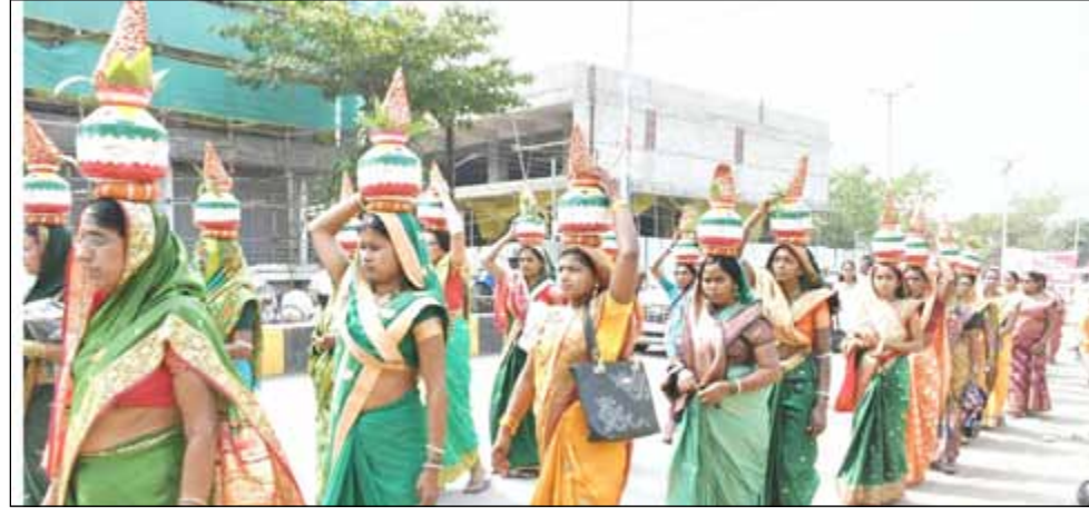
या मिरवणुकीमध्ये महिलांनी आपल्या हातात गुढी तसेच डोक्यावर तुळशीवृंदावन घेऊन रखरखत्या उन्हात या