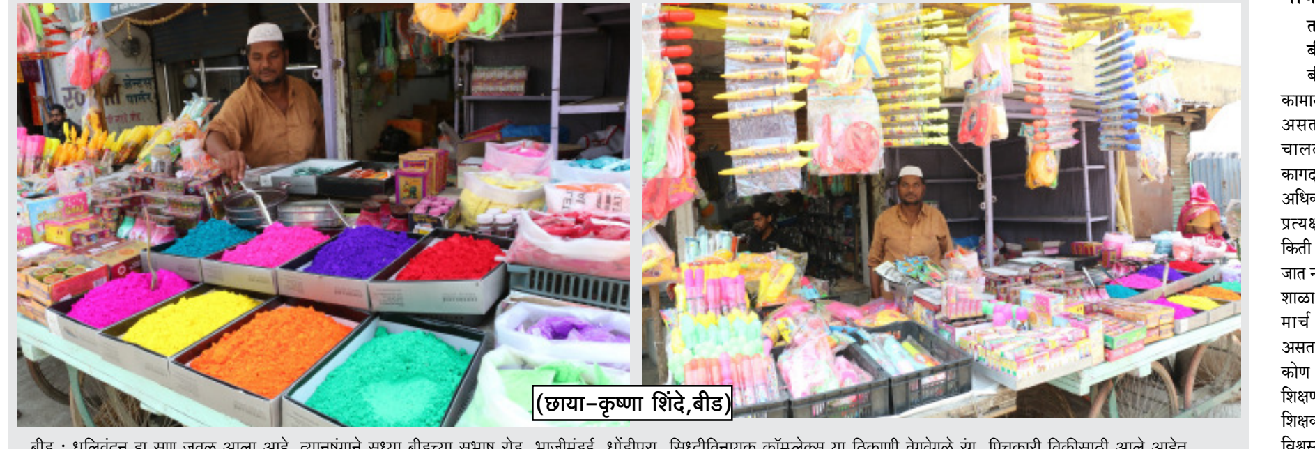
बीड : धुलिवंदन हा सण जवळ आला आहे. त्यानुषंगाने सध्या बीडच्या सुभाष रोड, भाजीमंडई, धोंडीपुरा, सिध्दीविनायक कॉम्प्लेक्स या ठिकाणी वेगवेगळे रंग, पिचकारी विक्रीसाठी आले आहेत.