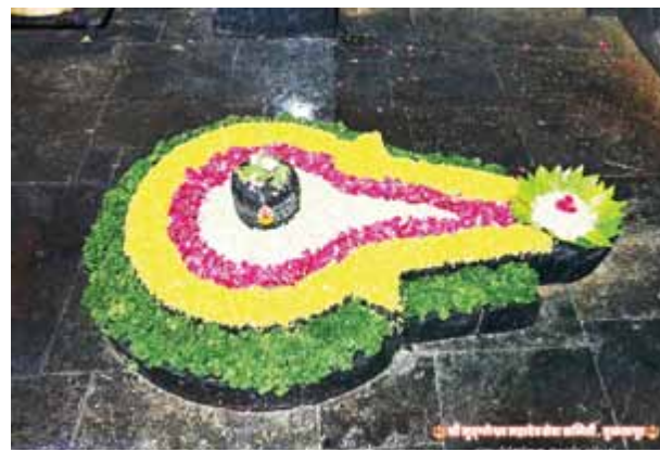
मंदिरात भव्य सुंदर रांगोळी काढण्यात आली होती दर्शनासाठी