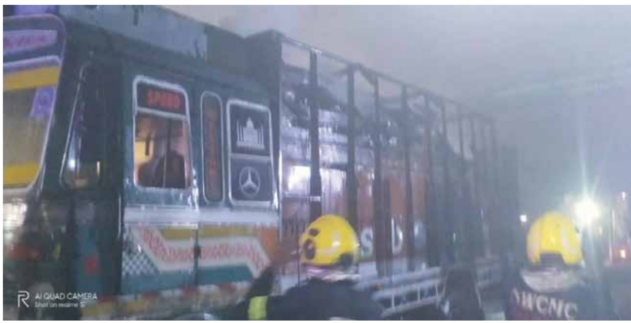
नांदेड-नांदेड ते देगलूर ट्रान्सपोर्टचे साहित्य घेऊन जात असलेल्या एका ट्रकला धनेगाव येथे आग लागल्याची घटना आज दि. ९ फेब्रुवारी रोजी घटनेचे ३ च्या सुमारास घडली. या आगीत ट्रकमधील फ्रीज, बॅटरी, इन्वर्टर, ड्राय फ्रुट, खाद्य तेल, स्टेनशील साहित्य, ओषधी आदी साहित्य जळून खाक झाले. आगीची माहिती मिळताच अग्निशमन दलाने तातडीने घटनास्थळी धाव घेत आग विझवली.