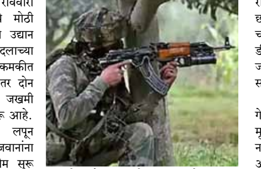
मिळालेल्या माहितीनुसार, बिजापूरच्या फरेसगड पोलिस स्टेशनच्या अंतर्गत येणाऱ्या

छत्तीसगड : छत्तीसगडमध्ये आज रिविचारी सुरक्षा दल आणि नक्षलवाद्यांमध्ये मोठी चकमक झाली. बिजापूरच्या राष्ट्रीय उद्यान परिसरात नक्षलवादी आणि सुरक्षा दलाच्या जवानांमध्ये ही चकमक झाली. या चकमकीत ३१ नक्षलवादी ठार झाले आहेत. तर दोन सैनिक शहीद झाले आहेत आणि २ जखमी झाले. सध्या परिसरात शोधमोहीम सुरू आहे. बिजापूर परिसरात नक्षलवादी लपून बसल्याची माहिती सुरक्षा दलाच्या जवानांना मिळाली होती. यानंतर शोध मोहीम सुरू असताना नक्षलवाद्यांनी अचानक गोळीबार करण्यास सुरुवात केली.