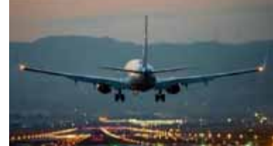
विमानात कितीजण आहेत, हे स्पष्ट झालेलं नाही. डोनाल्ड ट्रम्प यांच्या इमिग्रेशन अँड जेड राबण्यासाठी लष्कराचा वापर करत आहेत, ज्यामध्ये अमेरिका-मेक्सिको सीमेवर अतिरिक्त सैन्य पाठवणे, स्थलांतरितांना देशाबाहेर नेण्यासाठी लष्करी विमानांचा वापर करणे आणि त्यांना राहण्यासाठी लष्करी तळ उघडणे यांचा समावेश आहे. पॅट्रॉनने एल पासो, टेक्सास आणि सॅन दिएगो, कॅलिफोर्निया येथे

वॉशिंग्टन, ४ फेब्रुवारी : डोनाल्ड ट्रम्प प्रशासनाने कागदपत्र नसलेल्या स्थलांतरितांविरुद्ध तीव्र कारवाईला आता सुरुवात केली आहे. त्यानुसार, अमेरिकेत बेकायदा राहणाऱ्या स्थलांतरितांना घेऊन जाणारे अमेरिकेचे लष्करी विमान भारताकडे रवाना झाले आहे, अशी माहिती एका अधिकाऱ्याने दिली आहे. अधिकाऱ्यांनी दिलेल्या माहितीनुसार सी-१७ विमान स्थलांतरितांना घेऊन भारताकडे रवाना झाले आहे. परंतु ते किमान २४ तासांपर्यंत पोहोचणार नाही. यूएस इमिग्रेशन अँड कस्टम्स सैन्य पाठवणे, स्थलांतरितांना देशाबाहेर एन्फोर्समेंट (आयसीई) सुमारे १८ हजार कागदपत्रे नसलेल्या भारतीय नागरिकांची प्रारंभिक यादी तयार केली आहे. दरम्यान अमेरिकेहून भारताच्या दिशेने निघालेल्या