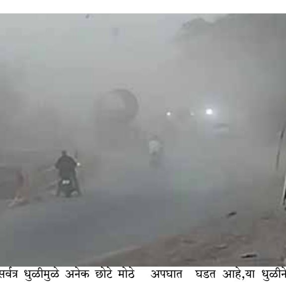
सर्वत्र धुळीमुळे अनेक छोटे मोठे अपघात घडत आहे, या धुळीने

तथा वृत्तसेवा बिडकीन दि ४ फेब्रुवारी : पैठण ते नक्षत्रवाडी पर्यंत जलवाहिनी टाकण्याचे काम व चौपटरीकरणाचे काम काही महिन्यांपासून चालू आहे बिडकीन चितेगाव येथे कित्येक महिन्यांपासून या कामामुळे रस्त्याची दूर अवस्था झाली रस्त्यावरती मोठाले खडे पडले असून रस्त्यावरून जड वाहतूक मोठ्या प्रमाणात वाढत असल्याने या वाहनांमुळे धुळीचे साम्राज्य पसरले आहे. शेकटा फाटा ते निलजगाव फाटा रस्त्याची संपूर्ण चाळण झाली असून यामुळे रस्त्यावर