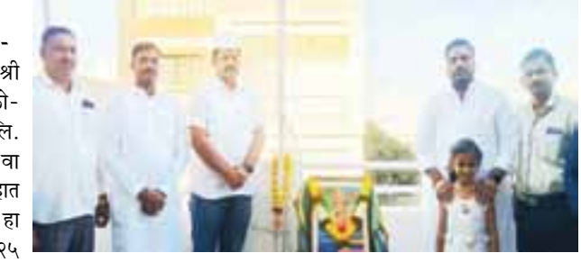
कार्यक्रमाच्या प्रारंभी ध्वजारोहण व भारतमाता प्रतिमेचे पूजन संस्थेचे संचालक हुंडे, तसेच सर्व कर्मचारी वृंद उपस्थित होते.

कृष्णा-मराठवाडा सिंचन प्रकल्पांतर्गत २१ टिएमसी पाणी जिल्हाला सिंचनासाठी उपलब्ध करून देण्याचे प्रस्तावित आहे. परंडा, भूम, वाशी, कळंब व धाराशिव तालुक्यातील ३५ गावातील १४ हजार ९३६ हेक्टर आणि तुळजापूर, उमरगा व लोहारा तालुक्यातील ५४ गावातील १० हजार २६२ हेक्टर शेतीला सिंचनाचा लाभ होणार आहे. जिल्हात पहिल्या टप्प्यामध्ये ५० नवीन बसेस लवकरच उपलब्ध करून देण्याचे नियोजन