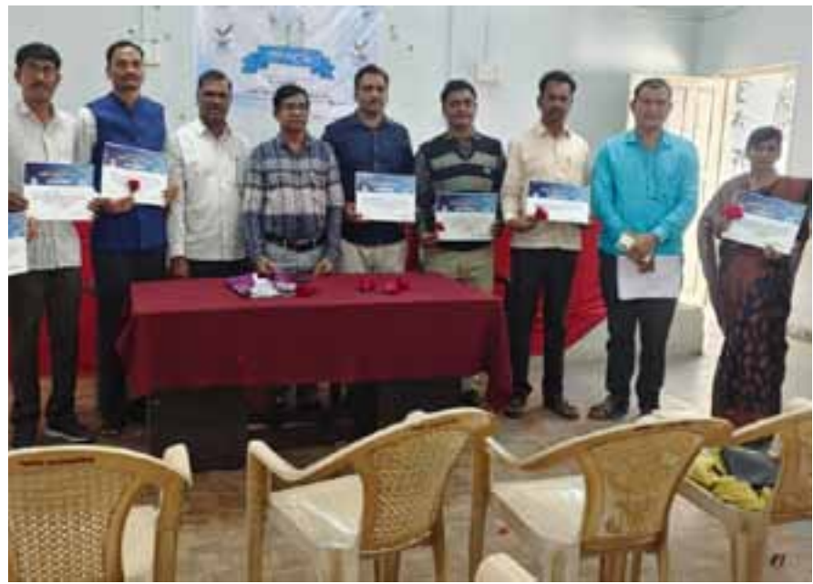
परभणी-आज दिनांक २५ जानेवारी २०२५ रोजी राष्ट्रीय मतदार दिनानिमित्त तहसील कार्यालय जितूर येथे उत्कृष्ट बीएलओ व विविध स्पर्धा घेण्यात आलेले विद्यार्थी व विद्यार्थिनी यांना प्रमाणपत्र वाटप करण्यात आले.

पारवा दरोडा : एक आरोपी पोलिसांच्या ताब्यात परभणी, प्रतिनिधी : परभणी तालुक्यातील मौजे पारवा शिवारातील शेत आखाड्यावरील दरोडा व सामूहिक अत्याचार प्रकरणात स्थानिक गुन्हा अन्वेषण विभागाने एका दरोडेखोरास वाळूज (जि.छत्रपती संभाजीनगर) परिसरातून अटक केली. पारवा शिवारात शेत आखाड्यावर दरोडा टाकून शेत मजूरांच्या कुटुंबियास बेदम मारहाण करण्यात आली होती. तसेच एका महिलेवर सामूहिक अत्याचार करून सोने-चांदीचे २ लाख ६ हजार रुपयांचे दागिणेही लंपास केले होते.