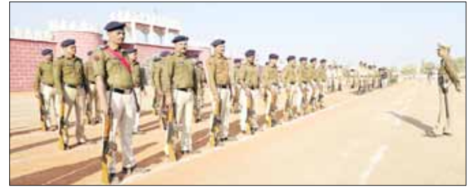
हिंगोली- येथील संत नामदेव पोलिस कवायत मैदानावर प्रजासत्ताक दिनानिमित्त पोलिस दल, राज्य राखीव दल, एनसीसी, स्काऊट आणि गाईड यांची पेरडची जोरदार तयारी सुरू आहे.

चर्चा होऊ लागली आहे. त्यामुळे पंचायत समितीचे लेखा परिक्षण करणारे स्थानिक निधी लेखा परिक्षण कार्यालयाचे संबंधित अधिकारी व कर्मचारी देखील जबाबदार असल्याचे बोलले जात असून संशयाची सुई त्यांच्याकडेही फिरू लागली आहे. या प्रकरणात आता लेखा परिक्षण कार्यालयाची चौकशी होणार का याकडे जिल्हा परिषदेचे लक्ष लागले आहे. सेनगाव पंचायत समिती नेहमीच वादग्रस्त राहिली असून याठिकाणी अधिकारी व कर्मचारी यांच्यावर येथील स्थानिक पुढाऱ्यांचाही प्रचंड दबाव आणि हस्तक्षेप असल्याने कोणीही काम करण्यास धजत नाही.