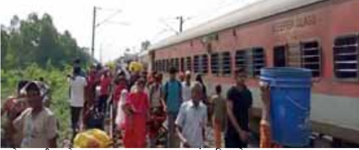
समोर आली आहे.

जळगाव : मुंबईकडे जाणाऱ्या पुष्पक एक्सप्रेसमध्ये आग लागल्याच्या भीतीने काही प्रवाशांनी चालत्या गाडीतून उड्या मारल्या. मात्र, समोरून येणाऱ्या बंगळूर एक्सप्रेसने त्यांना चिरडल्याने सहा ते आठ प्रवाशांचा मृत्यू झाल्याची दुर्दैवी घटना जळगाव जिल्हातील परांडा स्थानकाजवळ घडली आहे.