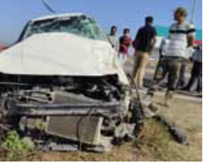
तभा वृत्तसेवा कन्नड :- दि.०२ जानेवारी - नवीन वर्षाच्या प्रारंभाला शहरातील युवकाला आपला जीव गमवावा लागल्याची दुर्दैवी घटना काल दि.०१ रोजी मध्यरात्रीच्या सुमारास घडली आहे,

सोलापूर-धुळे महामार्गावर शाकंभरी जिनिंग लागत दि.०१ रोजी मध्यरात्रीच्या सुमारास शहरातील युवक आपल्या चारचाकी वाहन क्र. एम.एच.२० जी.ई.२५५८ ने छत्रपती संभाजीनगर वरून कन्नडच्या दिशेने येत होते. जिनिंग लागत येताच वाहनाचे टायर फुटल्याने चालकाचा ताबा सुटून त्याची कार दुर्भागकाला जाऊन धडकली आणि कारने दोन ते तीन पलट्या घेऊन महामार्ग लागत पलटी झाली,अपघात एवढा गंभीर होता त्यात कार सर्व बाजूने