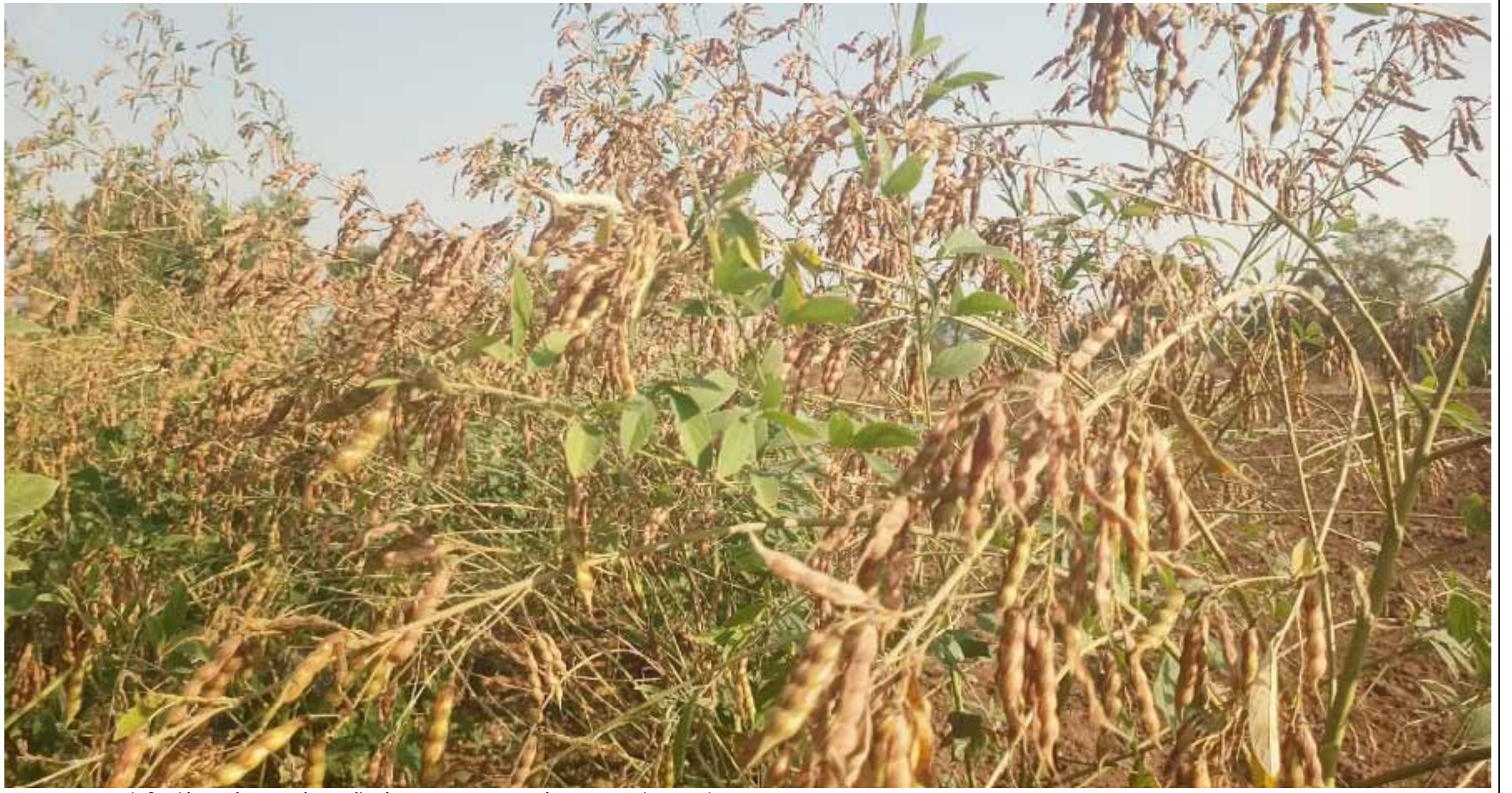
बीड तालुक्यात यावर्षी प्रतिवर्षी पेक्षा तुरीचे पीक बहरले असून शेंगा मोठ्या प्रमाणात लखडल्या आहेत.