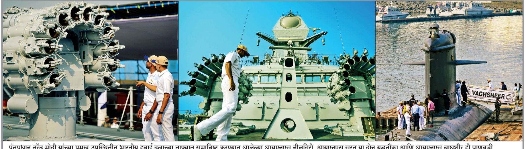
पंतप्रधान नरेंद्र मोदी यांच्या प्रमुख उपस्थितीत भारतीय हवाई दलाच्या ताप्यात समाविष्ट करण्यात आलेल्या आयएनएस नीलगिरी, आयएनएस सुरत या दोन युद्धनौका आणि आयएनएस वाघशीर ही पाणबुडी

२०२४ मध्ये झालेल्या पोटनिवडणुकांत रालोआला विजय मिळाल्याचा दावा झुकरबर्ग यांनी केला. झुकरबर्गच्या या वक्तव्यानंतर अनेक मंत्र्यांनी त्यांचावर टीका केली होती. माहिती व तंत्रज्ञान आणि दूरसंचार मंत्री अश्विनी वैष्णव यांनीही समाज माध्यमावरून त्याला प्रत्युत्तर दिले होते. जगातील सर्वात मोठी लोकशाही असलेल्या भारतात २०२४ मध्ये झालेल्या निवडणुकीत ६४ कोटी नागरिक सहभागी झाले. देशातील लोकांनी नरेंद्र मोदी यांच्या नेतृत्वातील रालोआ सरकारवर विश्वास दाखवला, असे त्यांनी या पोस्टमध्ये म्हटले होते. (वृत्तसंस्था)