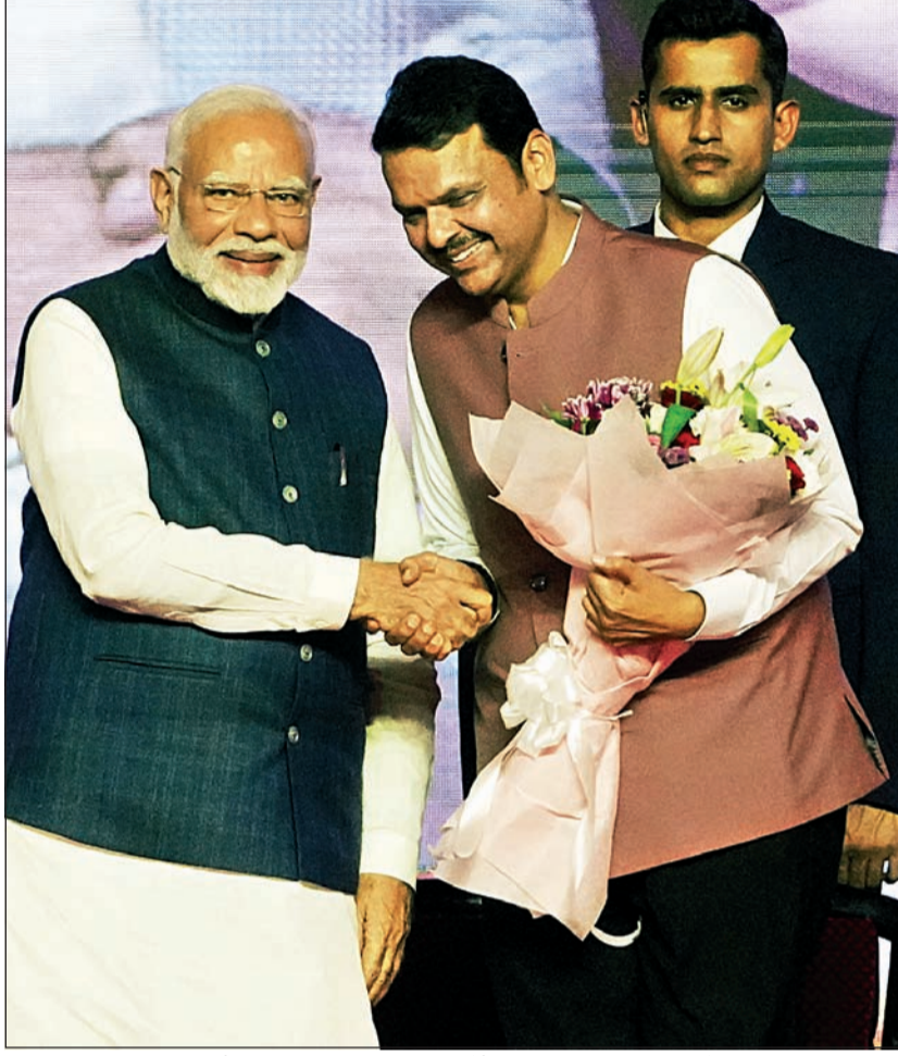
आझाद मैदानात आयोजित महाराष्ट्राचा मुख्यमंत्रिपदाची शपथ घेतल्यानंतर देवेंद्र फडणवीस यांचा हात हातात घेऊन अधिनंदन करताना पंतप्रधान नरेंद्र मोदी

पंतप्रधान नरेंद्र मोदी यांची विशेष उपस्थिती