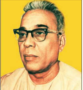
राष्ट्रीय स्वयंसेवक संघाचे तृतीय सरसंघचालक बाळासाहेब देवरास यांचा आज तिथीनुसार जन्मदिन