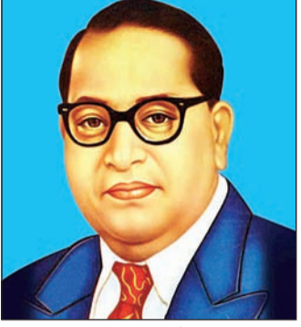
भारतीय घटनेचे शिल्पकार भारतरत्न डॉ. बाबासाहेब आंबेडकर यांचा आज महापरिनिर्वाणदिन