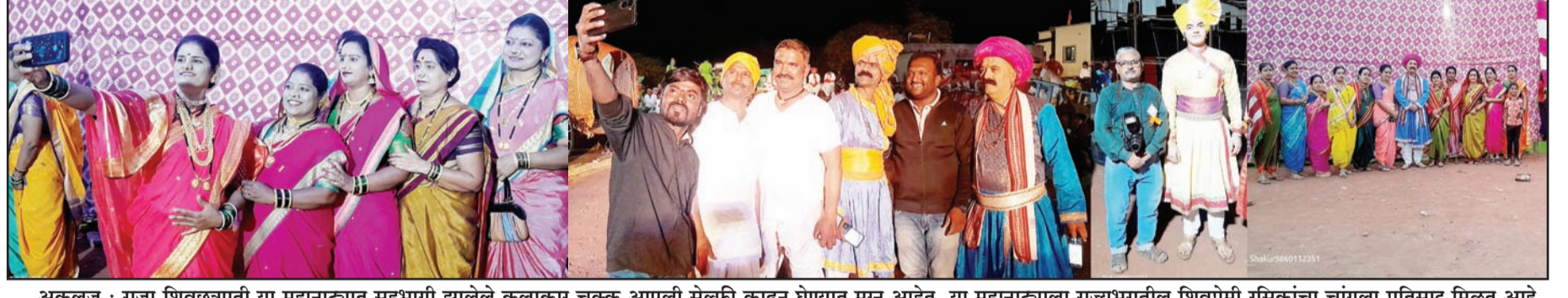
अकलूज : राजा शिवछत्रपती या महानाट्यात सहभागी झालेले कलाकार चक्क आपली सेल्फी काढून घेण्यात मग्न आहेत. या महानाट्याला राज्यभरातील शिवप्रेमी रसिकांचा चांगला प्रतिसाद मिळत आहे.