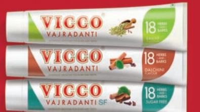
बडीघोष आणि दालिथी फ्लेवर्स शुगर फ्री मधेही उपलब्ध

हिरड्यांमधून रक्त, सूज आणि कमकुवत हिरड्यांच्या समस्यांनी त्रस्त आहात? आपल्याला पाहिजे एक गम एक्सपर्ट. विको वज्रवंती... यात आहे आवळा, बाभूळ, लवंग आणि ओवा यासारख्या १८ जडी-बुटी ज्या हिरड्यांच्या समस्यांना ठेवतात दूर आणि हिरड्यांना देवात मजबूती.