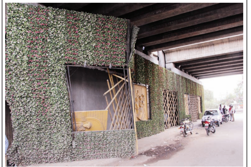
सोलापूर : तुळजापूर रोड पुलाखालील रस्त्याच्या बाजूला सुशोभीकरण करण्यात आले. त्याला ट्रॅव्हल्स बसने ठोकल्यामुळे नुकसान झाले. या बसवर प्रशासन कारवाई करणार का?