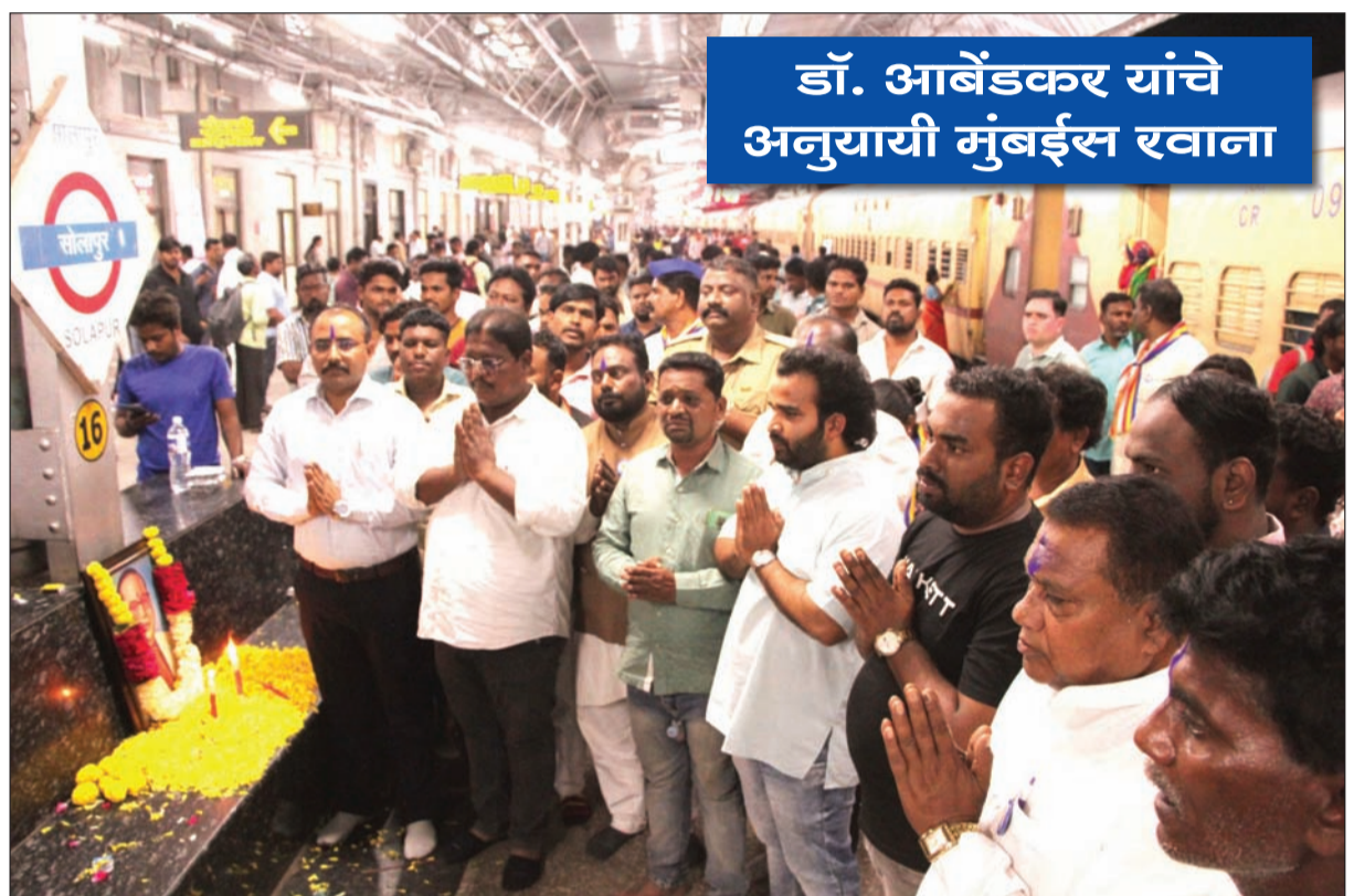
सोलापूर : महानिर्वाणदिनानिमित्त सोलापुरातील डॉ. बाबासाहेब आंबेडकर अनुयायी चैत्यभूमी दर्शनासाठी मुंबई रवाना होताना सोलापूर रेल्वे स्थानकावर गुरुवारी रात्री टिपलेले छायाचित्र.