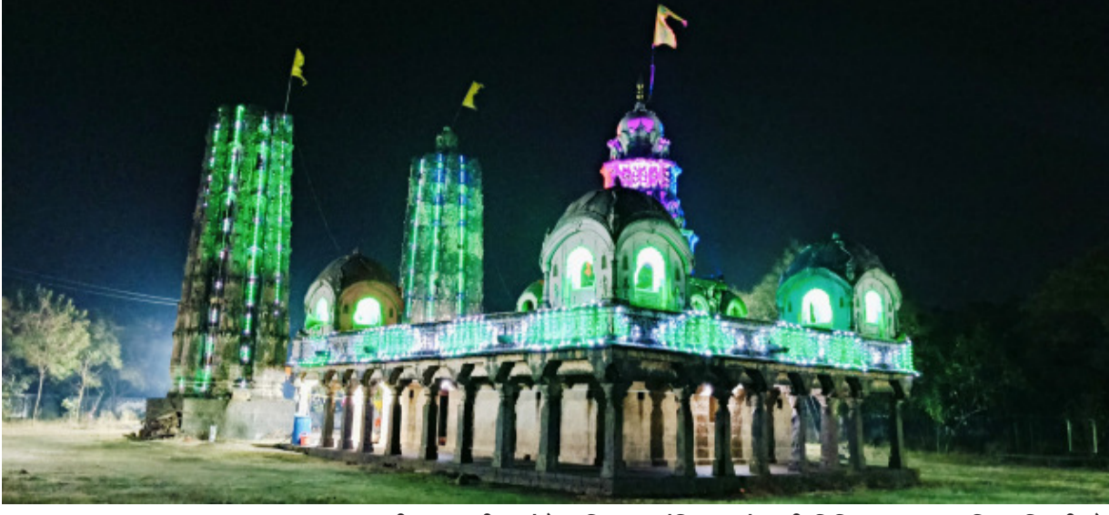
बीड शहरातील खंडोबा दिपमाळ मंदिरावर चंपाषष्ठी निमित्त शुक्रवार आणि शनिवारी दोन दिवस यात्रेनिमित्त मंदिरावर अशी विद्युत रोषणाई करण्यात आली आहे