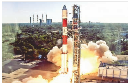
त्याच्या निश्चित कक्षेत अचूकपणे प्रस्थापित करण्यात आला आहे, असे इस्रोने म्हटले आहे.

सूर्याच्या कोरोनाचा अभ्यास करण्यासाठीचा हा महत्वाकांक्षी उपक्रम आहे. आंध्रप्रदेशातील श्रीहरिकोटा येथील सतीश धवन अंतराळ केंद्रातून गुरुवारी सायंकाळी ४:०४ वाजता प्रोबा-३ चे प्रक्षेपण करण्यात आले. पीएसएलव्ही-सी५९प्रोबा-३ मोहिमेने यशस्वीरीत्या प्रक्षेपणाची उद्दिष्टे साध्य केली आहेत. ईएसएचा उपग्रह