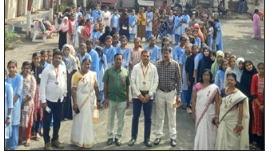
परळी वैजनाथ - उपजिल्हा रुग्णालय व लक्ष्मीबाई देशमुख महिला महाविद्यालयाच्या राष्ट्रीय सेवा योजना विभागाच्या वतीने जागतिक एड्स दिनानिमित्त सोमवारी (दि.०२) एड्स जनजागरण रॅलीचे आयोजन करण्यात आले होते.