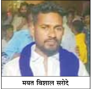
मयत विशाल सरोदे