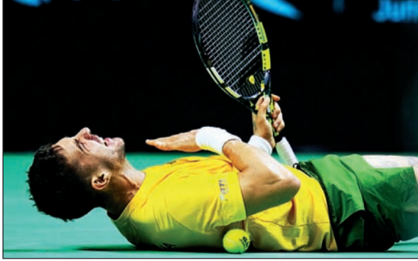
विजयाचा आनंद साजरा करताना थानासी कोक्वीनाकिस

डेव्हिस चषक टेनिस ♦ मालागा, २१ नोव्हेंबर येथे सुरू असलेल्या डेव्हिस चषक टेनिस स्पर्धेत उपांत्यपूर्व फेरीत ऑस्ट्रेलियाने अमेरिकेविरुद्ध १-० अशी आघाडी मिळवली.