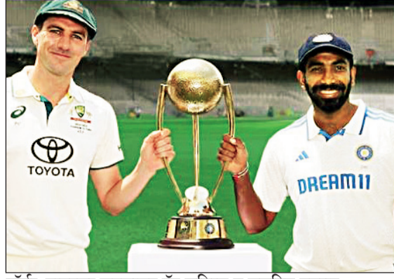
बॉर्डर-गावस्कर चषकासह पॅट कमिन्स व जसप्रित बुमराह

मायभूमीवर झालेल्या पराभवाच्या धक्क्यातून सावरत भारतीय क्रिकेट संघ शुक्रवारपासून येथे यजमान ऑस्ट्रेलियाविरुद्ध सुरू होणाऱ्या बॉर्डर-गावस्कर चषक पाच सामन्यांच्या कसोटी मालिकेत प्रतिस्पर्धी संघाला तोंड देण्यास सज्ज झाला आहे. भारताच्या फॉर्ममध्ये नसलेल्या फलंदाजी विभागाला ऑस्ट्रेलियाचा सामना तितक्याच सावधगिरीने खेळावे लागणार आहे. एकंदरीतच ऑस्ट्रेलियाविरुद्धच्या पहिल्या कसोटीत खेळताना भारतीय संघावर प्रचंड दबाव असेल. भारताने २०१८-१९ आणि २०२०-२१ मध्ये आम्ही लागोपाठ दोन वेळा बॉर्डर-गावस्कर चषक जिंकू शकतो, हे दाखवून दिले, परंतु अलिकडे ज्या पद्धतीने न्यूझीलंडने भारत भूमीवर भारतीय संघाचा पराभव केला, त्यामुळे निश्चितच भारतीय संघाच्या जागतिक दर्जाच्या मानसिकतेला धक्का बसला आहे. त्यामुळे या मालिकेत पॅट कमिन्स आणि त्याच्या चमूचा भारतीय संघ चक्रे सामना करतो, हे बघणे उत्सुकतेचे ठरणार आहे. सध्या भारतीय संघाला विक्रमी तिसऱ्यांदा जागतिक कसोटी अजिंक्यपद स्पर्धेच्या अंतिम फेरीत प्रवेश करणे दूरच्या स्वनासारखे दिसत आहे. इतर