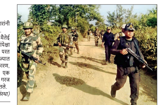
संवेदनशील भागात गस्त घालताना सुरक्षा दलाचे जवान