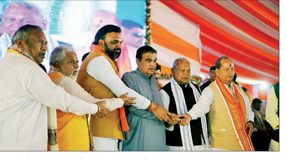
पाटणा येथील प्रकल्पांचे लोकार्पण करताना केंद्रीय मंत्री नितीन गडकरी व अन्य