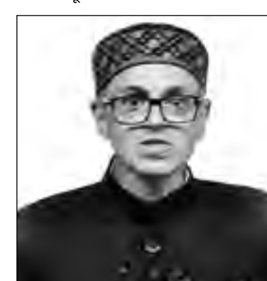
सर्व विधाने पाहता त्यांनी परिपक्वता दाखवली आहे, असे म्हणता येईल; पण सरकार चालवताना जनतेमध्ये जागृताय, तेव्हा त्यांना जनतेच्या प्रश्नांची उत्तरे घावी लागतील. अशा परिस्थितीत उपराज्यपालांवर त्यांचा दबाव येईल. उपराज्यपाल केंद्र सरकारच्या हातचे बाहूले असल्याने संघर्षाची परिस्थिती निर्माण होण्याची शक्यता आहे.

काही मलईदार खात्याची अपेक्षा केल्यांनंतर ओमर यांनी नकार दिल्याचे कदाचित राहुल-ओमर दरी रंदावली असावी. पूर्ण राज्याचा दर्जा मिळवण्यात सरकारमध्ये सहभागी होणार नाही, असा पवित्रा काँग्रेसने घेतला आहे. पाच अपक्ष आणि 'आप' च्या एका आमदाराने पाठिंबा दिल्याने नॅशनल कॉन्फरन्सला तशीही काँग्रेसची गरज राहिलेली नाही. ओमर यापूर्वी जम्मू-काश्मीरचे मुख्यमंत्री होते; पण त्या वेळी ते मोठे राज्य होते. त्यात लडाखही होता; पण आता जम्मू-काश्मीर आणि लडाख हे वेगळे केंद्रशासित प्रदेश झाले आहेत. जम्मू-काश्मीरमध्ये विधानसभा आहे आणि लडाखचे लोक सध्या दिल्लीत सहाय्या शेड्यूलबाबत आंदोलन करत आहेत. दिल्लीतील 'आप' सरकारप्रमाणे ओमर यांना अधिकारांसाठी संघर्षाची भूमिका घ्यावी लागेल. आतापर्यंत केलेली