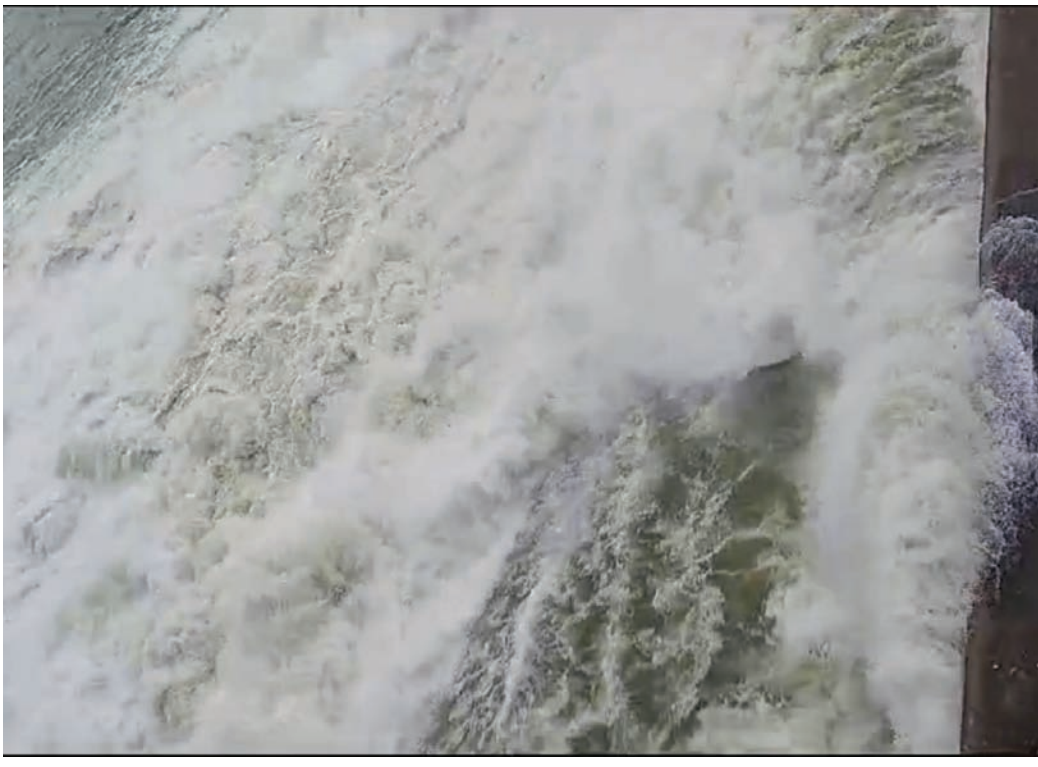
नांदेड - विष्णुपूरी प्रकल्पाच्या पाणलोट क्षेत्रात पाण्याची वाड झाल्याने शनीवारी सायंकाळी प्रकल्पाचे दोन दरवाजे उघडण्यात आले. या दरवाज्यातुन १९६ क्युमेक्स वेगाने पाण्याचा विसरंग होत आहे.