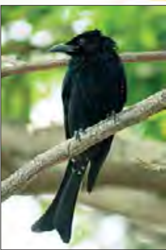
कोतवाल दोघेही मिळून पिलांचे संगोपन करतात. संपूर्ण काळा असल्याने कोतवालाला 'कोळसा' अशीही एक नाव आहे.

राहणे अधिक पसंत करणारे कोतवाल साधारणपणे गुरांच्या कळपात शिरून विविध कीटक पकडून खातात. त्याचमुळे, मुळात कीटकपक्षी असलेला कोतवाल क्वचितप्रसंगीच कीटक, परागकण आदी आपले खाद्य बनवतात. यांचे आणखी एक वैशिष्ट्य म्हणजे इतर पक्ष्यांनी आणलेले खाद्य हिसकावून खाण्यात ते तरबेज असतात. एप्रिल ते ऑगस्ट हा काळ कोतवालांचा वीणीचा हंगाम असून यांचे घरे जमिनीपासून ५ ते १० मीटर उंच झाडांवर खोलगट, काटक्यांनी व कोळ्याच्या जाळ्यांनी बनविलेले असते. तीन ते पाच संख्येत अंडी देणारी मादी कोतवाल आणि नर