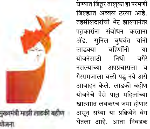
मुख्यमंत्री माद्री लाडकी बहिण योजना