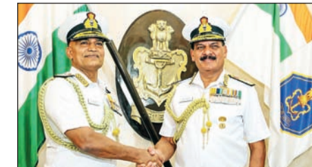
विविध धोरणात्मक जलमार्ग सुरक्षा आढ्याने निर्माण झाली असताना अॅडमिरल त्रिपाठी यांनी नौदलप्रमुख

नवी दिल्ली, ३० एप्रिल समुद्रातील संभाव्य शत्रूंना रोखण्यासाठी भारतीय नौदलाने नेहमी सज्ज राहावे, असे अॅडमिरल दिनेशकुमार त्रिपाठी यांनी मंगळवारी २६ वे नौदल प्रमुख म्हणून पदभार स्वीकारल्यानंतर सांगितले. दळणवळण आणि इलेक्ट्रॉनिक्स यत्नेतून असेल त्या अॅडमिरल त्रिपाठी यांनी आर. हरिकुमार यांच्याकडून नौदलाचा कार्यभार स्वीकारला. हुद्दी अतिरेक्यांनी विविध व्यापारी जहाजांना लक्ष केल्यामुळे लाल समुद्र आणि एडनच्या आखातात