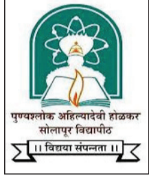
पुण्यश्लोक अहिल्यादेवी होळकर सोलापूर विद्यापीठ ॥ विद्या संवत्सरा ॥