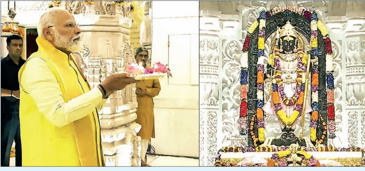
पंतप्रधान नरेंद्र मोदी यांनी रविवारी अयोध्येला भेट दिली आणि राम मंदिरात जाऊन रामललाचे दर्शन घेत, आरतीही केली. यावेळी मोदी यांनी रामललापुढे साष्टांग दंडवत घातले. त्यानंतर त्यांनी सुग्रीव किला ते लता मंगेशकर चौक असा रोड शो केला