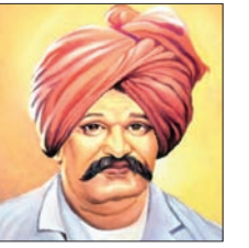
राजर्षी छत्रपती शाहू महाराज यांची आज पुण्यतिथी