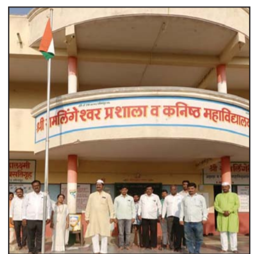
तीर्थ : श्री रामलिंगेश्वर प्रशाला व कनिष्ठ म हाविद्यालयात महाराष्ट्र व कामगार दिन साजरा झाला.