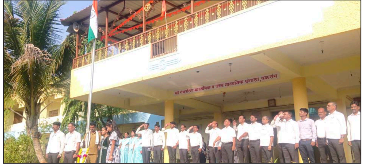
वळसंग : श्री शंकरलिंग माध्यमिक व उच्च माध्यमिक प्रशालेत महाराष्ट्र दिन व कामगार दिन साजरा करण्यात आला.