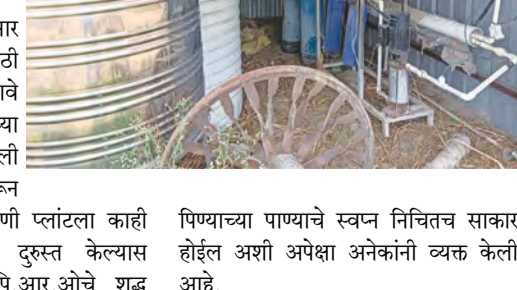
पिण्याच्या पाण्याचे स्वप्न निचितच साकार होईल अशी अपेक्षा अनेकांनी व्यक्त केली आहे.