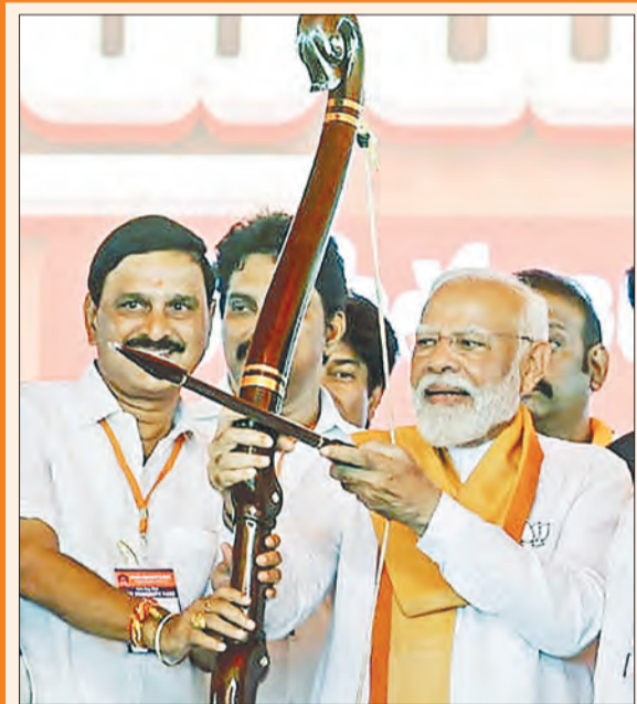
आंध्रप्रदेशच्या राजमंजूरी येथे सोमवारी आयोजित भाजपाच्या प्रचार सभेत पंतप्रधान नरेंद्र मोदी यांचा धनुष्यबाण देऊन सन्मान करण्यात आला.

एफएफजेचा प्रमुख आणि प्रतिबंधित दहशतवादी गुरपतवंतसिंग पन्नूने जारी केलेल्या एका व्हिडीओचा उल्लेख तक्रारीत करण्यात आला. २०१४ आणि २०२२ दरम्यान खलिस्तानी गटांनी आपला १.६० कोटी डॉलर्स दिल्याचा आरोप त्याने व्हिडीओत केला होता.