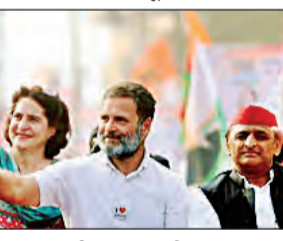
आतापर्यंत झालेल्या १५ पंतप्रधानांपैकी नऊ जणांनी उत्तरप्रदेशातील मतदारसंघातून निवडणूक जिंकली आहे.

आजही उत्तरप्रदेशचे महत्त्व अबाधित आहे. म्हणूनच मोदी यांनीही दोन वेळा वाराणसी मतदारसंघातून आतापर्यंत निवडणूक लढवली. देशात