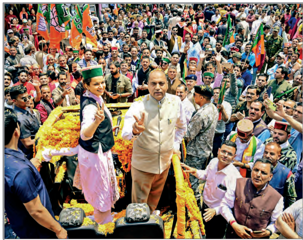
हिमाचल प्रदेशच्या मंडी जिल्ह्यात भाजपा उमेदवार कंगना राणावतने प्रचाराचा धडाका लावला आहे. सोमवारी राज्याचे मुख्यमंत्री जयराम ठाकरे हे देखील कंगनासोबत प्रचारार सहभागी झाले होते