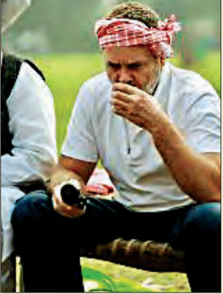
'मुसाफिर हूँ यारों ना घर हैं, ना ठिकाना मुझे चलते जाना हैं बस...चलते जाना'

गुलजार यांनी हे अप्रतिम गाणे लिहिले. तेव्हा अगदी ५२ वर्षांपूर्वी त्यांना याची सुतरामही कल्पना नसावी की, त्यांच्या गाण्याच्या ओळी गांधी घराण्याच्या सुपुत्राला अगदी चपखल बसतील. ज्या पद्धतीने त्यांची मुशाफिरी चालते, त्यावरून तरी त्यांना 'मुसाफिर'चे म्हटले पाहिजे. त्यांची भटकंती कायम एका मतदारसंघातून दुसऱ्याकडे, एका देशातून दुसऱ्या देशात, एका खटल्यासाठी एका राज्यात तर दुसऱ्यासाठी आणखी कुठे अशी सुरूच असते. वायनाडमधून त्यांनी उमेदवारी अर्ज दाखल केला, तेथे मतदानही झाले. मग पुन्हा रायबरेलीत येण्याचे प्रयोजन काय? हे आता देशातील जनतेला पुरते कळते आहे. एकतर त्यांना वायनाडमध्ये जिकण्याची शाश्वती नसावी किंवा आपला सुरक्षित गड सोडण्याचा नाही, ही भावना असावी. दोन्ही ठिकाणी मुद्दा असुरक्षिततेचाच आहे ना! ही असुरक्षितता आज निर्माण झालेली नाही. मागील १५ वर्षांपासून त्यांना राजकारणात 'सेटल' करण्याचा जीवतोड प्रयत्न सुरू आहे. मात्र, ते काही केल्या स्थिरावलेले नाहीत. बरे, कधीतरी सक्रिय झाले, असे वाटू लागतात ते थेट 'मामाच्या गावा'ला निघून जातात. (म्हणजे निदान असे सांगितले जाते... प्रत्यक्षात कुठे जातात, कोणालाच माहिती नाही म्हणे)