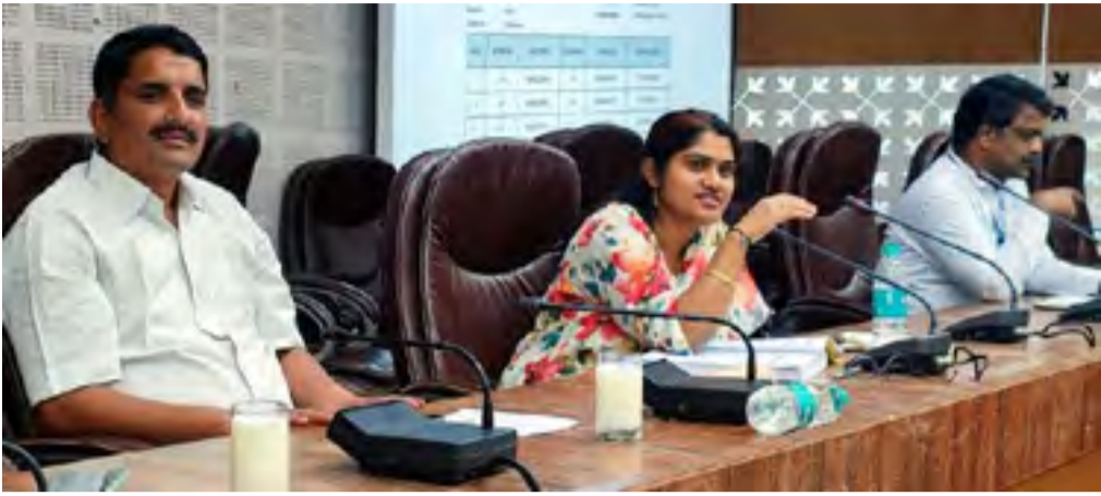
तथा वृत्तसेवा वीडि दि.६ एप्रिल