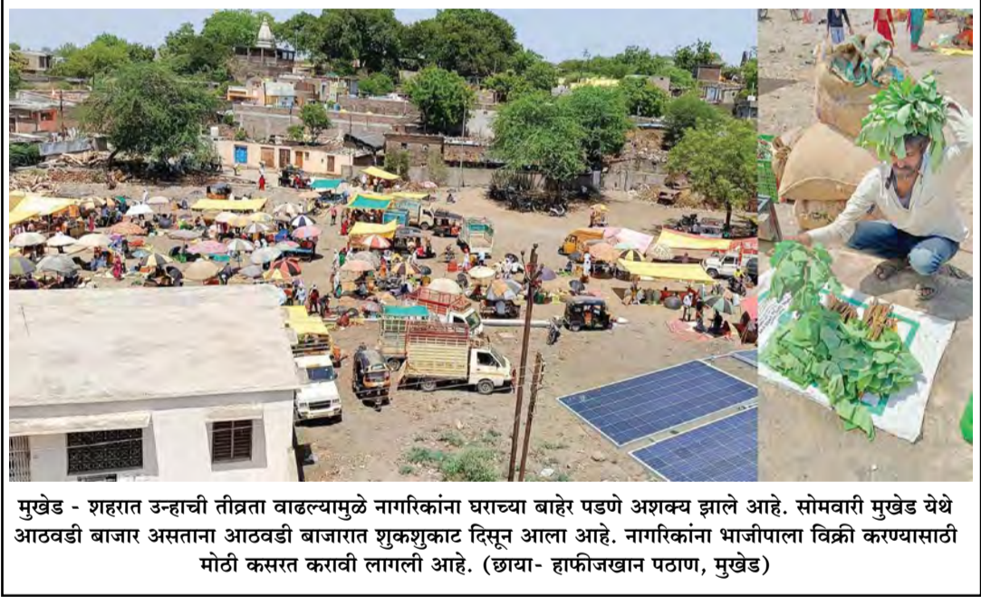
मुखेड - शहरात उन्हाची तीव्रता वाढल्यामुळे नागरिकांना घराच्या बाहेर पडणे अशक्य झाले आहे. सोमवारी मुखेड येथे आठवडी बाजार असताना आठवडी बाजारत शुकशुकाट दिसून आला आहे. नागरिकांना भाजीपाला विक्री करण्यासाठी मोठी कसरत करावी लागली आहे.

जल जीवन मिशन अंतर्गतची प्रभावी सार्वजनिक नळ योजना मंजूर झाली. या योजनेचे काम चालू झाल्यानंतर पाईपलाईन खोदकाम म्हणून गावातील रस्ते खोदून पाईपलाईन टाकण्यात आली. परंतु खोदलेल्या रस्त्यावरून चालतांना येथील नागरिकांना त्रास सहन करावा लागत आहे. या खोदकाम केलेल्या रस्त्याच्या दुरुस्तीचे काम हे पाणीपुवट्याच्या ठेकेदाराकडे आहे. आता येणारा पावसाळा एका महिन्यावर येऊन ठेपला आहे. नळ योजनेचे काम अपूर्ण असल्यामुळे आता रस्ते दुरुस्तीचे काम केंब्ला होणार आहे असा प्रश्न नागरिक उपस्थित करीत आहेत. या बाबीकडे वरिष्ठांनी तात्काळ लक्ष घालून येथील पाणीपुवटा योजनेच्या थांबलेल्या कामाला पावसाळ्या आगोर पूर्ण करण्याच्या सूचना संबंधित गुतेदारांना देऊन तातडीने खोदलेल्या रस्त्याचे अपूर्ण काम पूर्ण करण्यासाठी व जल जीवन योजनेचे चालू असलेले काम पूर्ण करण्याच्या सूचना संबंधितांना द्याव्यात अशी मागणी ईस्लापूर येथील नागरिकांतून केली जात आहे.