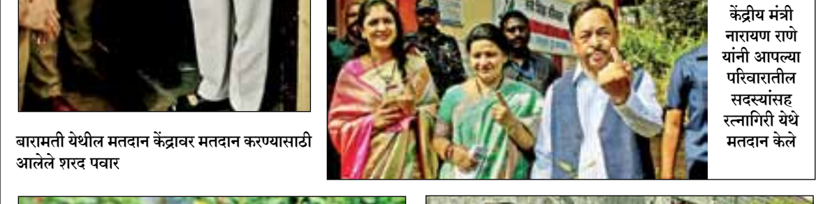
केंद्रीय मंत्री नारायण राणे यांनी आपल्या परिवारातील सदस्यांसह रत्नागिरी येथे मतदान केले