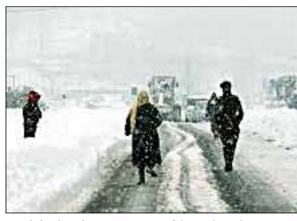
अनंतनाग-राजौरीचे मतदान पुढे ढकलण्याची मागणी केली होती. त्यामुळे आयोगाला हा निर्णय घ्यावा लागला.

♦ नवी दिल्ली, ७ मे अनंतनाग-राजौरी मतदारसंघात तिसऱ्या टप्प्यात म्हणजे ७ मेला मतदान होणार होते, पण त्या भागात बर्फवृष्टी सुरू असल्याने निवडणूक घेणे शक्य नसल्यामुळे निवडणूक आयोगाने तेथील निवडणूक पुढे ढकलली आहे, आता या मतदारसंघात सहाव्या टप्प्यात म्हणजे २५ मेला मतदान होणार आहे. भाजपासह राज्यातील प्रमुख राजकीय पक्षांनी येथील मतदान पुढे ढकलण्याची मागणी केली होती. त्यामुळे आयोगाला हा निर्णय घ्यावा लागला. पीडीपीच्या नेत्या मेहबूबा मुफ्ती या मतदारसंघातून रिंगणात आहे. गुलाम नबी आझाद यांनी अनंतनाग-राजौरी मतदारसंघातून निवडणूक लढवण्याची घोषणा केली होती, पण त्यांनी शेवटच्या क्षणी माघार घेतली.