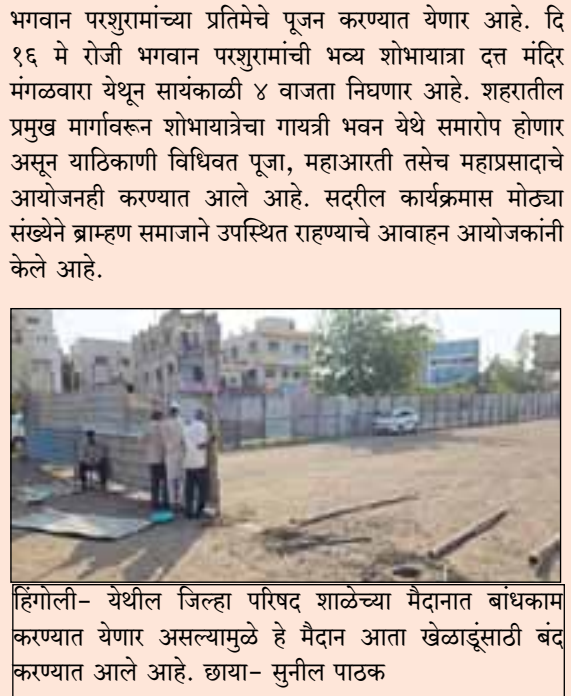
हिंगोली- येथील जिल्हा परिषद शाळेच्या मैदानात बांधकाम करण्यात येणार असल्यामुळे हे मैदान आता खेळाडूसाठी बंद करण्यात आले आहे.

हिंगोलीत भगवान परशुराम जयंतीनिमित्त शोभायात्रा हिंगोली- भगवान परशुराम जयंतीनिमित्त दरवर्षीप्रमाणे याहीवर्षी सकल ब्राम्हण समाजाच्यावतीने दि १६ मे रोजी शहरातून भव्य शोभायात्रा काढण्यात येणार आहे तसेच दि १० मे रोजी रेल्वे स्टेशन रोडवरील गायत्री भवनात सकाळी ११ वाजता सकल ब्राम्हण समाजाच्यावतीने भगवान श्री परशुराम जयंतीनिमित्त