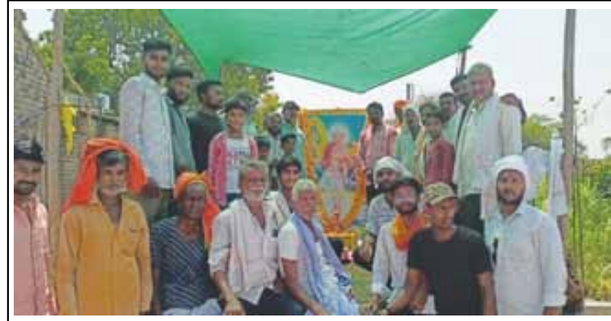
मुदखेड - स्वाभिमानी कुंभार समाजाच्या वतीने श्री संत शिरोमणी गोरोबा काका यांच्या नियोजित जागेच्या ठिकाणी प्रतिमेचे पुजन करून ७०७ वी पुण्यतिथी साजरी करण्यात आली.