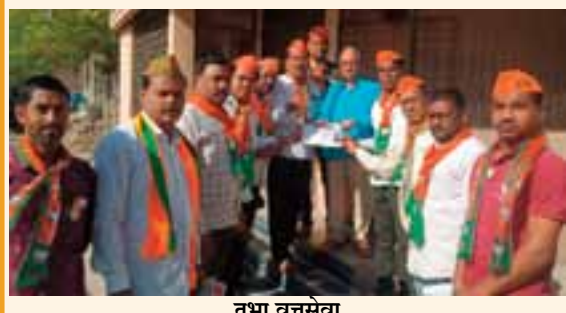
तथा वृत्तसेवा जाफ्राबाद/प्रतिनिधी

दानवे यांच्या प्रचारार्थ जाफ्राबाद शहरातील घरोघरी जाऊन प्रचार