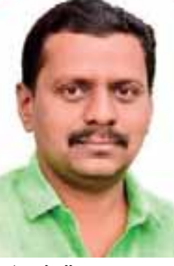
मराठा क्रांती मोर्चाचे

मोर्चे शांततेत पार पडले आहेत. पक्ष विरहित संघटनेची ही वज्रमुठ कायम ठेवून मराठा क्रांती मोर्चाचे मोर्चाचे सत्ताधारी आणि विरोधक यांना सारख्याच अंतरावर ठेवले आहे. 'खरे तर विरोधक असो या सत्ताधारी कोणीच आपल्या निवडणूक जाहीरनाम्यात मराठा आर-क्षणबाबत ब्र शब्दही काढलेला नाही. त्यामुळे