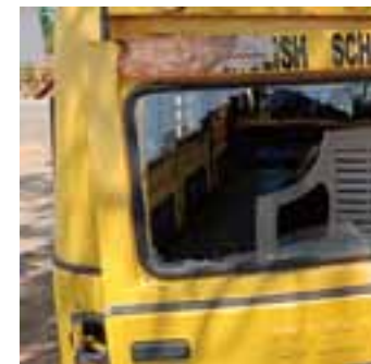
तथा वृत्तसेवा मंडा / प्रतिनिधी

मंडा येथील उमरखेडा रोडवर डॉ. बाबासाहेब आंबेडकर मुलींच्या शासकीय वस्तीग्रहाच्या पाठीमागे द वर्ल्ड इंग्लिश स्कूल च्या प्रांगणात उभ्या असलेल्या मंडा पोलीस स्टेशनला स्कूलबसच्या काचा फोडून बॅटरी