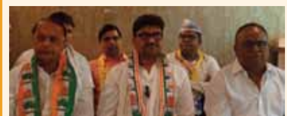
तथा वृत्तसेवा जालना / प्रतिनिधी