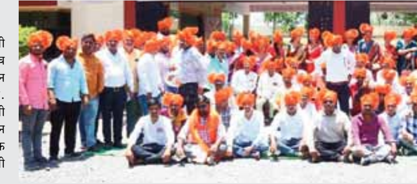
जुन्या आठवणी ताज्या झाल्या.

तथा वृत्तसेवा अंबड / प्रतिनिधी अंकुशनगर येथील छत्रपती शिवाजी हायस्कूल च्या २००५-२००६ बॅच च्या माजी विद्यार्थ्यांचे स्नेहसंमेलन रविवारी मोठ्या उत्साहात पार पडले. या स्नेहसंमेलनाची सुरुवात सरस्वती पूजनाने करण्यात आली. यावेळी दोन मिनेट मौन बाळगून दिवंगत शिक्षक व विद्यार्थी आनी भावपूर्ण श्रद्धांजली देण्यात आली.