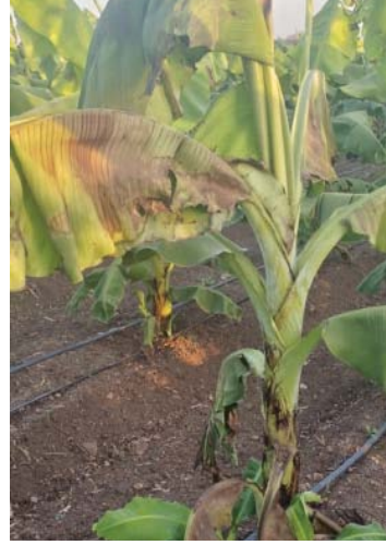
जाग्यावर करपत आहेत. देवी डीपी, नारायण डीपी, के एम डीपी चा समावेश असून महावितरणच्या तगाद्यामुळे शेतकऱ्यांनी

तथा वृत्तसेवा मुदखेड, ५ मे - शेतकऱ्यांच्या बाबतीत कायमच प्रशासन उंटावरून शेतकऱ्या हाकण्याच्या प्रयत्नात असतो. याची प्रचिती बारड भागातील केळी उत्पादक शेतकऱ्यांना पुन्हा पुन्हा येत असून रोहित्री अभावी केळीच्या भागच करपत नसून शेतकऱ्यांचे काळीजही जळतेय अशी परिस्थिती असताना महावितरणचे अधिकारी उण्णेतेच्या लाटेत गारेगार होण्यासाठी चौपाटीचा आसरा घेताना दिसत आहेत. त्यामुळे एकीकडे रोहित्रा अभावी शेतकऱ्यांचा दैवदुर्बिलास पहावयास मिळत असताना महावितरणचे अधिकारी मात्र थंड हवेची ठिकाण शोधत आहेत. बारड ३३ के व्ही उपकेंद्र अंतर्गत तीन रोहित्र जळल्याने केळीच्या उभ्या बागा