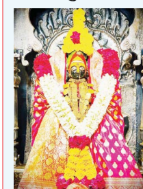
दर्शनासाठी गर्दी येत आहे.

श्री तुळजाभवानी मंदिरात शनिवारी नवविवाहीत दांपत्यांची दर्शनासाठी तसेच वाहूर जत्रेसाठी गर्दी झाली होती. गुरू आणि शुक्र यांचा अस्त असल्याने लग्न सोहळ्याच्या तारखा नाही. लग्न सोहळ्याच्या तारखा संपलेल्या आहेत. २ मेपर्यंत झालेले विवाह सोहळ्यातील दांपत्य सध्या श्री तुळजाभवानी मंदिरात दर्शनासाठी गर्दी येत आहे.