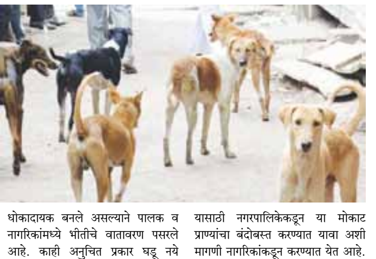
धोकादायक बनले असल्याने पालक व नागरिकांमध्ये भीतीचे वातावरण पसरले आहे. काही अनुचित प्रकार घडू नये यासाठी नगरपालिकेकडून या मोकाट प्राण्यांचा बंदोबस्त करण्यात यावा अशी मागणी नागरिकांकडून करण्यात येत आहे.

टोळक्यापासून पहाटे मॉर्निंग व शाळेसाठी घराबाहेर पडणाऱ्या लहान मुलांपासून ते ज्येष्ठ नागरिकांच्या सुरक्षेचा प्रश्न निर्माण झाला आहे. शहरातील अनेक भागातील परिसरात भीतीचे वातावरण पसरले आहे येथे भटक्या कुत्र्यांचा व जनावरांचा होदोस राजेरोसपणे पाहायला मिळतोय दिवसा आणि रात्री हे भटके कुत्रे येणाऱ्या जाणाऱ्या नागरिकांच्या आंगावर धावून जातात येथील नागरिकांचे म्हणणे आहे की, हातात दोन चाकी वहाणावरील पिशवी हिसकावून येत आहेत. मुख्य रस्त्यावरील शाळेच्या विद्यार्थ्यांना ये - जा करणाऱ्या विद्यार्थ्यांसाठी हे मोकाट प्राणी