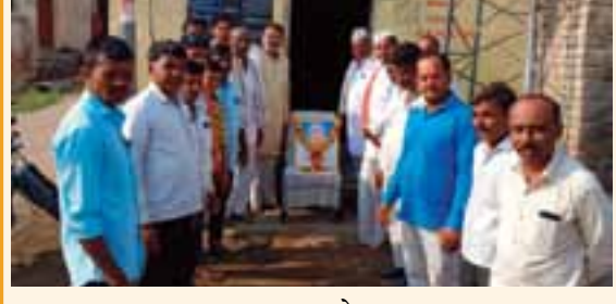
तथा वृत्तसेवा अंबड / प्रतिनिधी

राष्ट्रसंत तुकडोजी महाराज यांची जयंती भनंग जळगाव साजरी अंबड १ एप्रिल भनंग जळगाव येथे सरपंच उपसरपंच यांनी केली राष्ट्रसंत तुकडोजी महाराज जयंती साजरी भनंग जळगाव येथील ग्रामपंचायत कार्यालय मोठ्या थाटात जयंती साजरी करण्यात आली यावेळी सरपंच उपसरपंच. ग्रामपंचायत सदस्यग.गावातील सर्व मान्यवर उपस्थित होते .