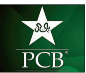
आयोजन करण्याची संधी देण्यात आली आहे. पीसीबीचे अध्यक्ष मोहसीन

लाहोर, २९ एप्रिल पाकिस्तान क्रिकेट बोर्ड (पीसीबी) ने चॅम्पियन्स चषक २०२५ साठी आंतरराष्ट्रीय क्रिकेट परिषद (आयसीसी) कडे तीन स्थळांचा प्रस्ताव ठेवला आहे. लाहोर, कराची आणि रावळपिंडी ही तीन ठिकाणे आहेत. चॅम्पियन्स चषक २०२५ चे यजमानपद पाकिस्तानला मिळाले आहे. मात्र, भारत या स्पर्धेसाठी पाकिस्तानला जाणार की नाही हे अद्याप स्पष्ट झालेले नाही. अहवालानुसार, पीसीबीने तीन ठिकाणांचा मसुदा आयसीसीकडे सादर केला आहे. पुढील वर्षी फेब्रुवारी-मार्चमध्ये ही स्पर्धा होणार आहे. १९९६ च्या एकदिवसीय विश्वचषकानंतर पहिल्यांदाच पाकिस्तानला आयसीसी स्पर्धेचे