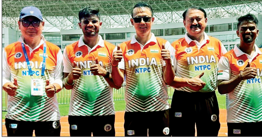
ऐतिहासिक सुवर्णपदक पटकावणारे भारतीय तिरंदाज