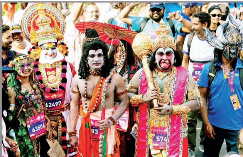
बंगळूरु येथे रविवारी आयोजित मॅरॉनन स्पर्धेत राम, हनुमान व इतर विविध वेशभूषांमध्ये लोकांनी सहभाग घेतला