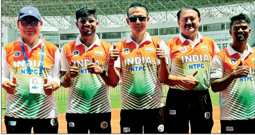
ऐतिहासिक सुवर्णपदक पटकावणारे भारतीय तिरंदाज