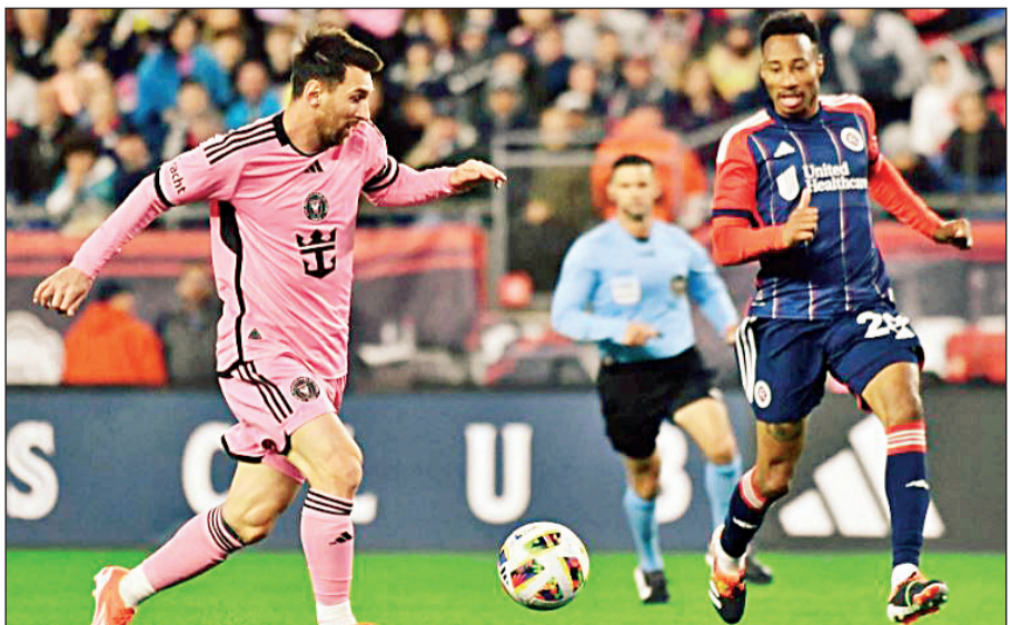
न्यू इंग्लंड रिव्हॉल्यूशनविरुद्धच्या एमएलएस सामन्यात चेंडूसाठी संघर्ष करताना इंटर मियामीचा लियोनेल मेस्सी